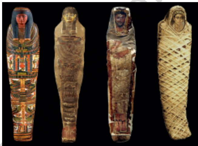
fig. 3 - Persistance de l'image du visage à travers les différentes époques de l'Égypte ancienne (de l'époque dynastique à l'époque gréco-romaine).

En latin, « sarcophagus » désigne le tombeau. En réalité, le terme est plus ancien et provient du grec ancien « sarkophagos » : « mangeur de chair ou de viande » ou « pierre calcaire qui consume la chair ». En écriture hiéroglyphique, le sarcophage s'écrit « neb ankh » qui signifie « maître ou possesseur de vie », montrant ainsi une différence sémantique importante, tant dans l'usage que dans l'esprit. Au départ, une simple caisse en bois ou en pierre sert de sarcophages aux défunts. Peu à peu, les parois se couvrent de motifs symboliques et de textes funéraires. À l'intérieur d'un grand nombre de sarcophages, on trouve un deuxième cercueil anthropoïde en bois, en tissu ou en papyrus enduit de plâtre et de stuc, décoré à l'extérieur de motifs de couleur rehaussés de dorure. Dans la majorité des cas, les formes du corps sont peu évoquées, tandis que le visage est souvent expressif, voire personnalisé. Parfois, certaines momies bénéficient de plusieurs cercueils emboîtés, notamment les pharaons qui possèdent souvent en plus un masque funéraire en or massif [19] (fig. 3).