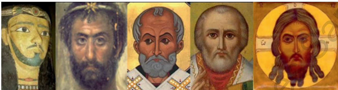
fig. 7 - Transmission du canon esthétique du visage de l'Égypte pharaonique au christianisme oriental sur un même support de bois (sarcophages et planches iconographiques).

l'imaginaire, nous permettent de prendre conscience de l'impact de l'image du visage dans la mémoire collective (civilisations, traditions, religions).