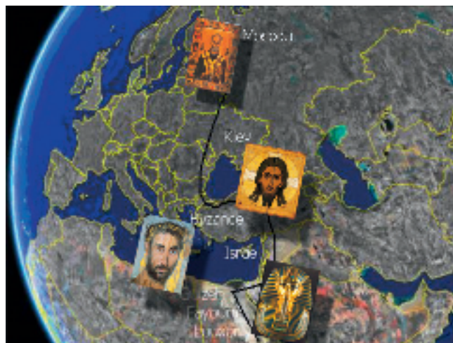
fig. 6 - Résonances socioculturelles de l'image du visage : un voyage à travers le temps et l'espace.