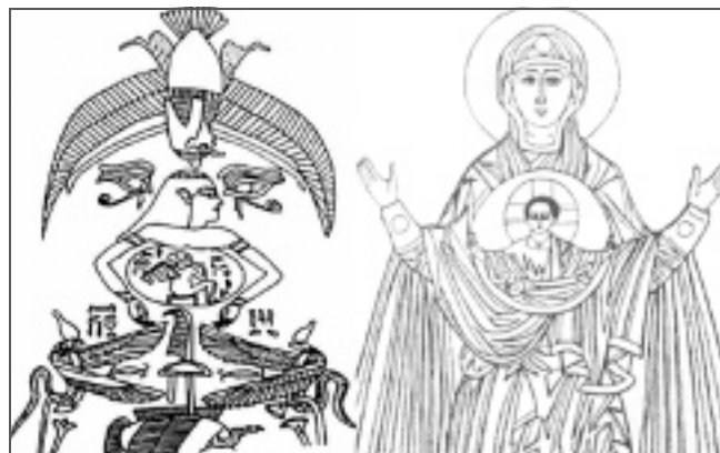
fig. 8 - Transmission archétypale de l'image de l'enfant solaire garant de la renaissance de l'Égypte pharaonique au christianisme.

L'icône ouvre une fenêtre sur le sacré pour que le visage devienne l'expression de la transcendance. De l'Égypte pharaonique au christianisme oriental, la représentation du visage a évolué à travers le temps et l'espace sur un support en tous points quasi identique. Du sarcophage en bois à la « simple planche » iconographique, un même médium a permis de passer de l'homme à la divinité (fig. 9). La prothèse faciale est assimilée à ce médium qui psychologiquement sert à idéaliser un autre visage, reconfiguré dans une nouvelle identité (fig. 10).