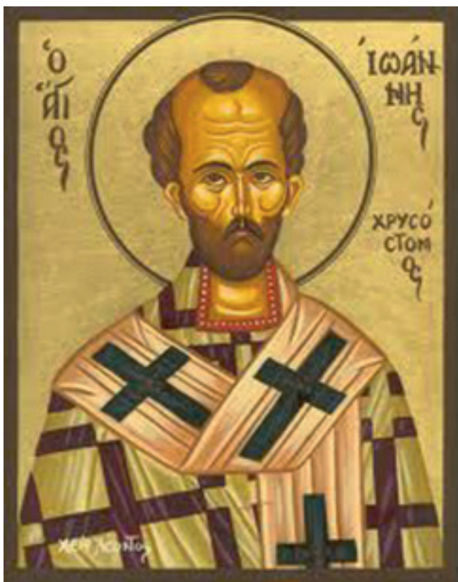
fig. 2 - Saint Jean Chrysostome, « bouche d'or ».

celle où le Christ, lors de la Cène, a institué l'Eucharistie. L'analyse étymologique et sémantique de la « prothèse » souligne ainsi son caractère à la fois matériel et immatériel. En médecine, lorsque la prothèse est destinée à remplacer une partie de la face ou du visage, elle est à la fois bio-objet et image [9].