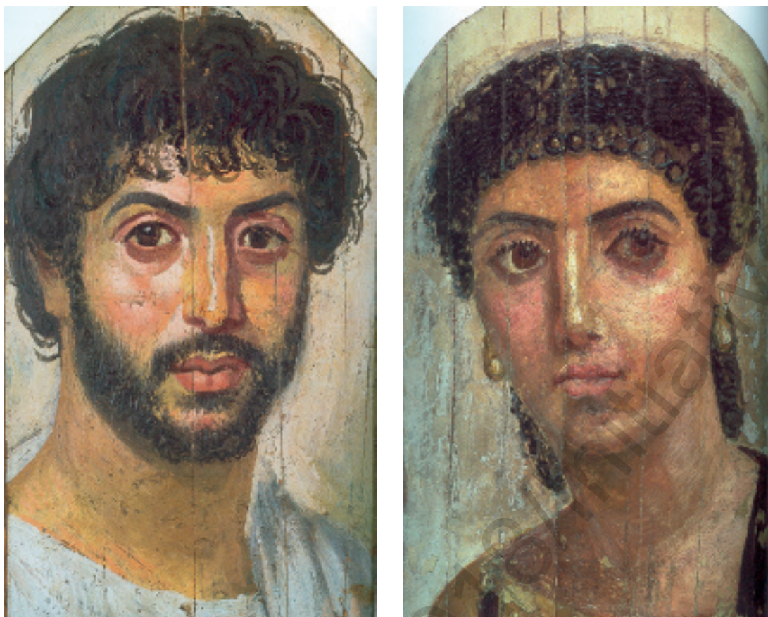
fig. 4 - Portraits du Fayoum.

ter à la forme du haut du corps. L'artiste trace ensuite une esquisse de son modèle en noir ou à l'ocre rouge et utilise une palette chromatique très riche. Les portraits du Fayoum sont peints selon deux techniques :