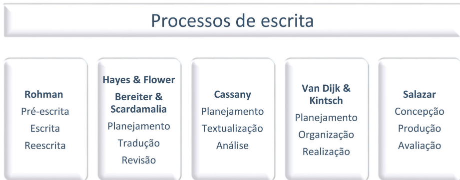
Esquema 1. Algumas abordagens teóricas que representam o modelo não linear

Não vamos nos propor à análise de todos esses modelos, mas nos deteremos em três teorias; as duas primeiras se concentram nas necessidades do público adulto (HAYES & FLOWER, 1980; CASSANY, 1989), enquanto a terceira abordagem analisa o processo de escrita levando em consideração as competências que possuem os escritores treinados e não treinados (SCARDAMALIA & BEREITER, 1982). Essas teorias nos fornecerão os elementos necessários para darmos sequência à nossa análise.