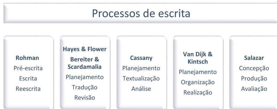
Esquema 1. Algumas abordagens teóricas que representam o modelo não linear

Não vamos nos propor à análise de todos esses modelos, mas nos deteremos em três teorias; as duas primeiras se concentram nas necessidades do público adulto (HAYES & FLOWER, 1980; CASSANY, 1989), enquanto a terceira abordagem analisa o processo de escrita levando em consideração as competências que possuem os escritores treinados e não treinados (SCARDAMALIA & BEREITER, 1982). Essas teorias nos fornecerão os elementos necessários para darmos sequência à nossa análise.