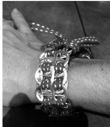
Bracelet ouverture de canette