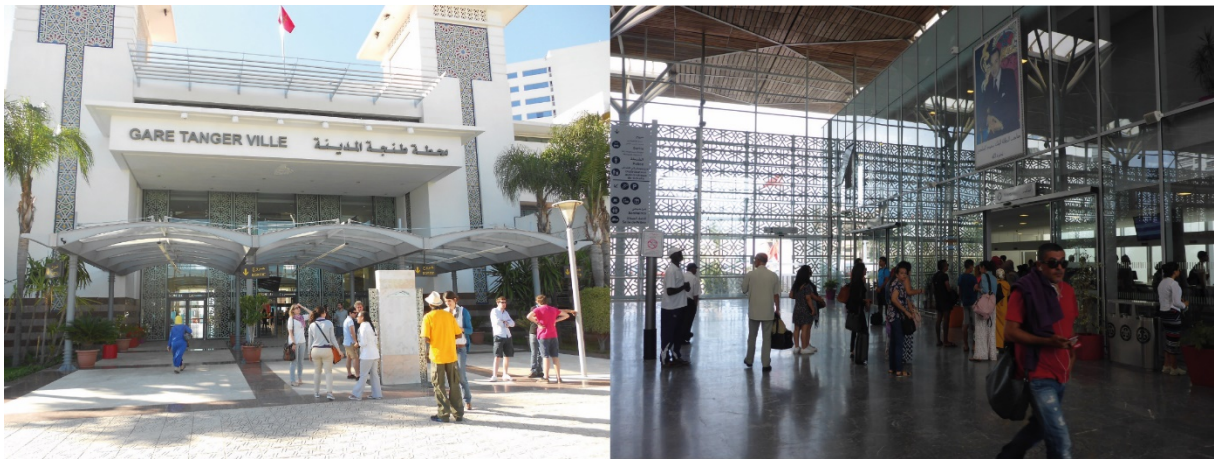
1. Les gares de Tanger (à g.) et de Casablanca (à d.) (N. Mareï, avril 2013 et juillet 2017)

Que ce soit dans le nord du Maroc, pour l'ensemble du pays ou au niveau international, la ville de Tanger développe une polarité particulière. Le projet de Tanger-Med participe aux reconfigurations urbaines et régionales. Il s'accompagne de la mise en œuvre, dans cette cité de longue date tournée vers le monde (statut de zone internationale de 1923 à 1958), d'un type particulier de métropolisation. Le déplacement du port de commerce à 40 kilomètres du centre-ville a entraîné un ensemble de transformations urbaines : le remblai est terminé, les navires de croisière y font escale, des tours et hôtels modernes sortent de terre, la gare TGV est prête. La ligne à grande vitesse, inaugurée en novembre 2018, est gérée par l'ONCF et relie Tanger à Rabat et Casablanca ( cf. photographies 1) (Baron, 2017). Elle participe au renforcement multimodal d'un axe urbain, littoral et national. Les acteurs du secteur marchand rencontrés espèrent que le fonctionnement à grande vitesse libérera des sillons pour l'acheminement du fret interurbain entre Tanger et Casablanca. En effet, avec Tanger-Med, la capitale du Nord est devenue une zone d'ancrage de différentes multinationales, en particulier du secteur de la grande distribution, qui utilisent le port et ses zones franches comme plate-forme de redistribution nationale et internationale, renforçant ainsi les circulations sur l'axe littoral jusqu'à Casablanca et au-delà.