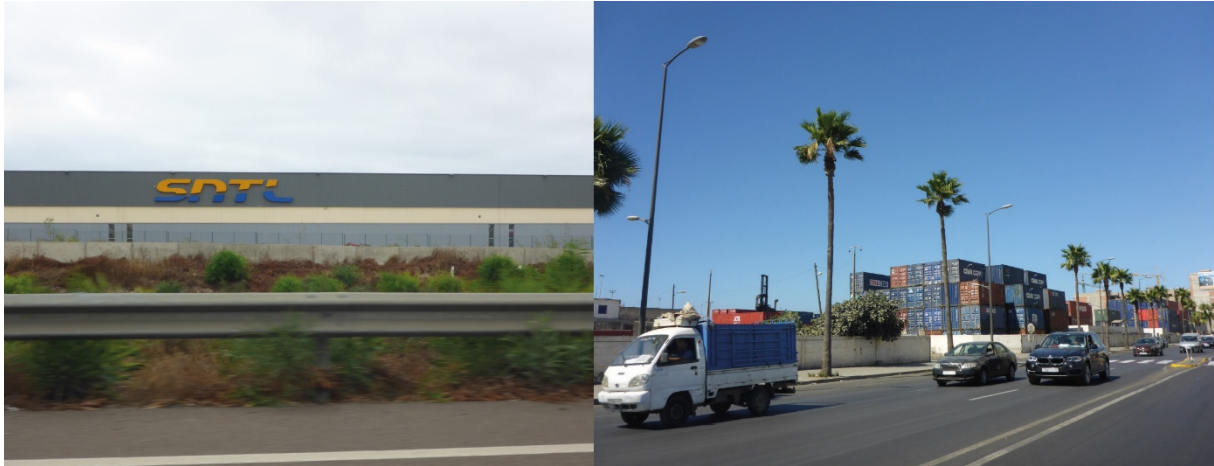
3. Entrepôts SNTL le long de l'autoroute (à g.) et zone de stockage du terminal à conteneurs du Port de Casablanca (à d.) (N. Mareï, juillet 2017)