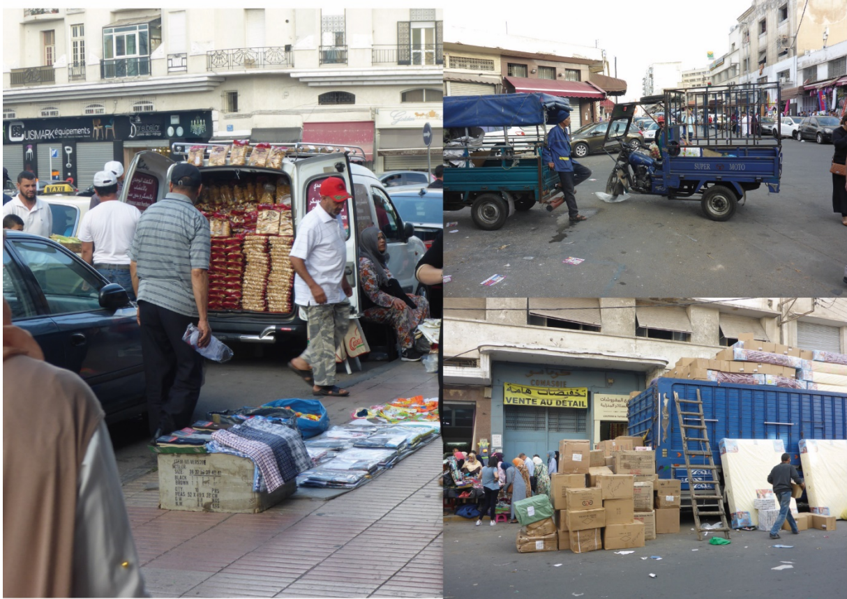
4. La distribution urbaine dans le quartier Derb Omar (N. Mareï, juillet 2017)