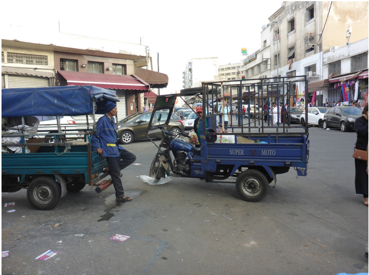
Couverture : Triporteurs pour la distribution urbaine, quartier Derb Omar, Casablanca (N. Mareï, juillet 2017)

Nora Mareï, Jean Debrie et Jérôme Lombard