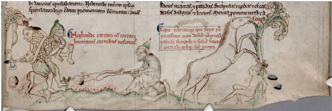
Figure 2 : Représentation de nomades Tatars. Enluminure de Matthew Paris, XIII ème siècle (CCC MS 16, FOL. 167R).

Ces peuples nomades ont pourtant dominé les vastes steppes d'Eurasie pendant des millénaires. Même l'Europe occidentale, située aux confins des terres émergées, géographiquement la plus à l'écart du berceau asiatique, a reçu et s'est construite par la succession des différentes vagues culturelles des "barbares" des steppes dont la sédimentation est la source principale de son histoire 17 . La plus célèbre de ces invasions qu'a dû subir l'Empire romain d'Occident fut celle des Huns, au IV e et V e siècle après J.-C. Leur origine est controversée mais l'hypothèse la plus probable fait d'eux les descendants des Hunnu 18 . En s'agrégeant avec des tribus eurasiatiques aux origines ethniques diverses, ils ont activé une force de frappe terrifiante. Attila, leur roi, a marqué l'Histoire en devenant l'archétype du "chef barbare" pour l'Europe occidentale 19 .