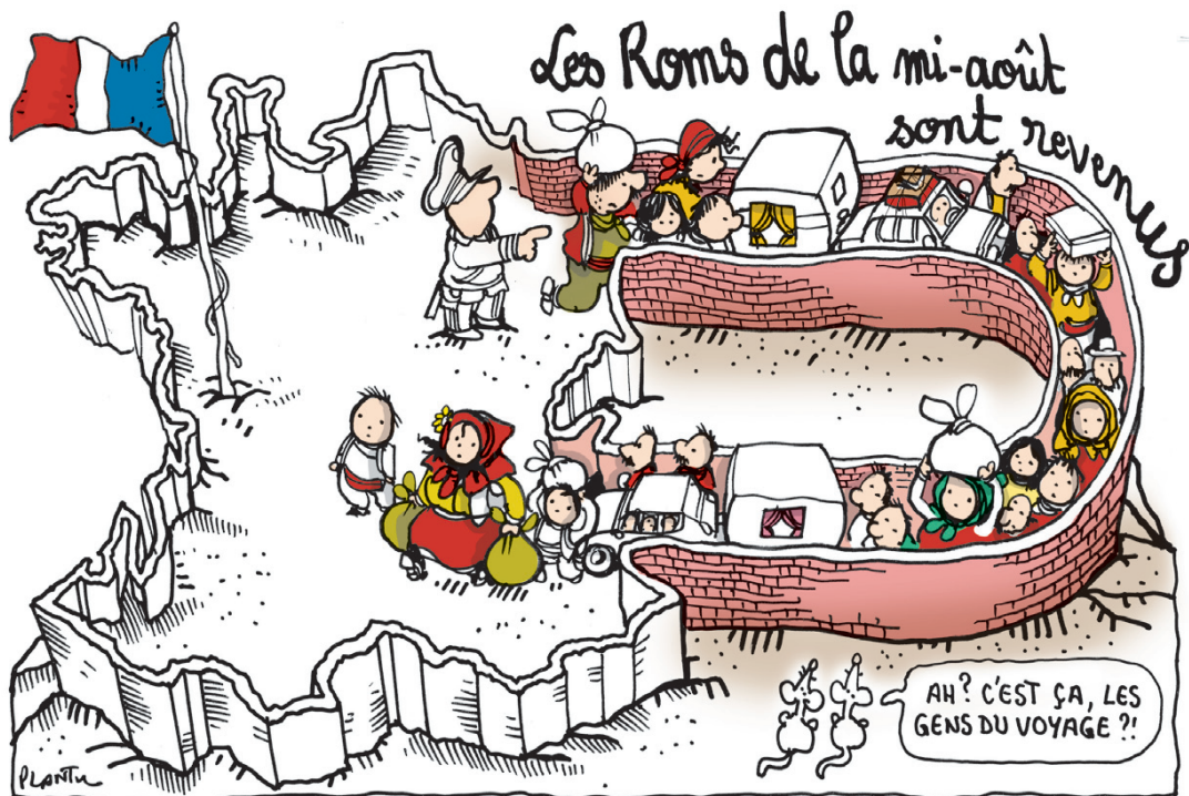
Figure 4 : Le Monde du 19.08.2010.

et les époques 23 . Il est établi qu' "On n'admet pas aujourd'hui d'Etat nomade ; la population doit avoir un minimum de fixité. De fait, une assise territoriale favorise le sentiment national" 24 . Ce mot est le synonyme en Occident d'une pléthore de termes connotés péjorativement : vagabond, homme errant, Rom, gens du voyage, itinérant, Sans Domicile Fixe (SDF), Gitan, Tzigane, mendiant 25 , etc. Dans ce contexte, le "nomade" véhicule un stéréotype négatif de pauvreté et de marginalité par rapport à l'idéal sédentaire (fig. 4).