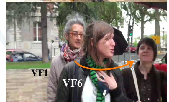
Aparté (parole en privé ?)