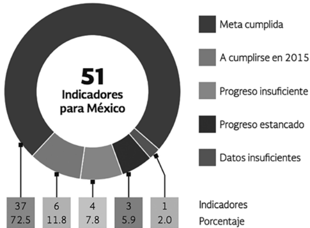
Figura 1 Balance general de cumplimiento de los ODM

Fuente: “Los Objetivos de Desarrollo del Milenio en México” (Presidencia de la República, 2015).