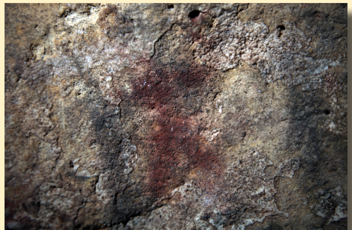
Figura 3. Representación parietal de un antropomorfo esquemático.

Las representaciones documentadas hasta el momento se concentran en un único panel, degradado por el efecto de la excesiva humedad y la frecuentación actual de la cueva, con una distribución espacial amplia que no permite definir composiciones significativas. Entre los motivos conservados, destaca la representación de un antropomorfo con piernas y brazos abiertos, éstos últimos perpendiculares al eje que dibuja el tronco (fig. 3). No es tanto la calidad en su ejecución como su individualidad y la posición central que ocupa en el panel los factores que acentúan su singularidad al otorgarle un espacio preferente de representación. Una concepción en el uso del espacio gráfico que también observamos en la composición de algunas decoraciones cerámicas con motivos antropomorfos similares documentadas en Sarsa y en otros yacimientos del Neolítico valenciano.