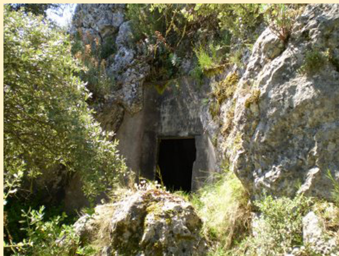
Figura 1. Boca de entrada a la cueva.

El conjunto de materiales que ha proporcionado la cueva es variado: industria lítica y restos de talla, industria ósea, objetos de adorno, piedra pulida y abundante cerámica. También se han recuperado restos antracológicos, carpológicos y de fauna. De todos ellos, es la cerámica la que ha adquirido mayor importancia en la historia de la investigación neolítica, de la que se han realizado diferentes publicaciones (San Valero, 1950; Asquerino, 1978; Asquerino et al. , 1998; Pérez Botí, 1999 y 2001; García Borja y Casanova, 2010). El conjunto cerámico ha sido recuperado básicamente en dos momentos: uno bajo la dirección de F. Ponsell en las primeras décadas del siglo XX (Ponsell, 1929) y otro bajo la dirección de M. D. Asquerino entre los años 70 y 80 (Asquerino, 1978; Asquerino et al. , 1998). El material se completa con multitud de piezas donadas por vecinos y aficionados (Asquerino, 1976 y 1978), y otras procedentes de intervenciones más puntuales (Casanova, 1978). Recientemente, debemos destacar el hallazgo de representaciones parietales pertenecientes al Horizonte Esquemático en estancias interiores (Miret et al. , 2008), estudiadas dentro de los proyectos HUM2004/05643/Hist. y GVPRE/2008/203, que reavivan el debate sobre la funcionalidad y singularidad de Sarsa en el territorio de los grupos neolíticos.