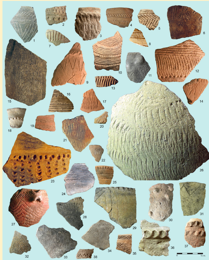
Figura 2. Selección de fragmentos cerámicos con los diferentes tipos decorativos documentados.