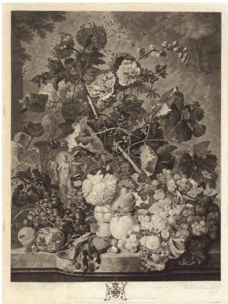
III. 4. Richard Earlom, Fleurs et fruits , manière noire, chez John Boydell, 1781, état avant toute lettre. BnF, Estampes, Réserve AA-5 (Earldom, Richard).

En revanche Duchesne ignore délibérément le fac-similé, manière de crayon, de lavis, d'aquarelle, pastel, procédés inventés au cours des années 1750, ainsi que toutes les estampes d'après Watteau, Boucher, Chardin, Greuze ou Vernet. De même, pour le XVIII e siècle français, il n'expose aucune vignette d'Eisen, Saint-Aubin, Cochin pour le livre, qui furent tant appréciées en leur temps et dans le demi-siècle qui suivit sa mort, mais seulement quelques interprétations de peintures d'histoire ou de portraits par Balechou 37 , Beauvarlet 38 et Wille 39 . Son intention est d'éduquer le public, de l'amener à apprécier le travail des artistes tout en lui livrant des informations sur sa carrière, afin de maintenir son attention en éveil par la diversité des détails qu'il lui donne. À propos de L'Instruction Paternelle de Johann Georges Wille d'après Gérard Ter Borch (ill. 5), il précise : « On admire dans cette