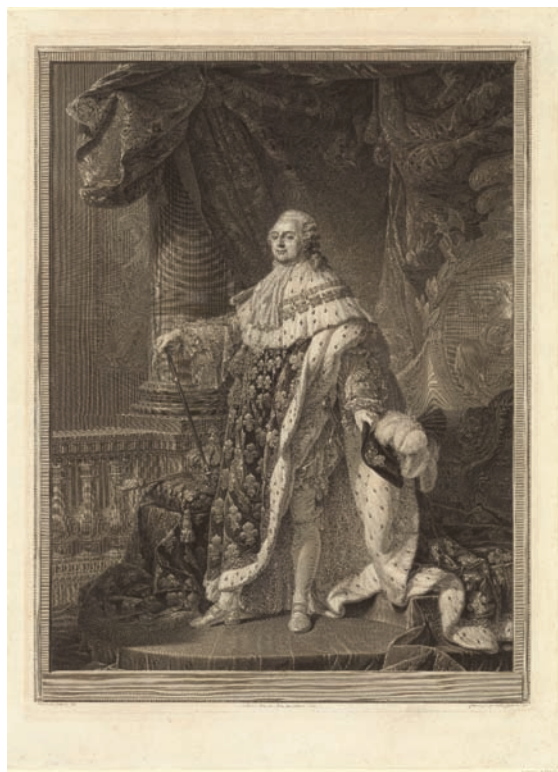
III. 13. Charles Bervic, Louis XVI , d'après Antoine Callet, 1790, 2 nd état. BnF, Estampes, Réserve AA-5 (Bervic, Charles-Clément).