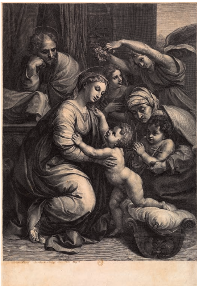
III. 9. Gérard Edelinck, Sainte Famille de François I er , burin. BnF, Estampes, Réserve EF-100-Boîte Écu.