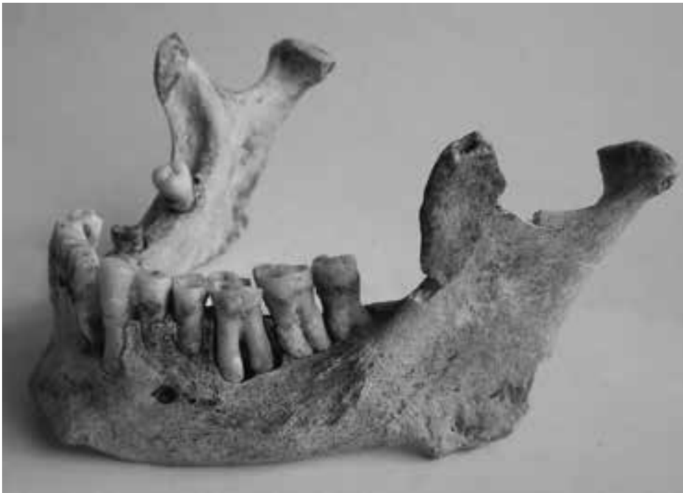
Fig. 5. Loron. Vue latérale gauche de la mandibule du défunt : au premier plan, présence de tartre, usure dentaire, abcès et réaction inflammatoire du périoste ; au second plan, perte ante-mortem de la deuxième prémolaire et de la deuxième molaire droites