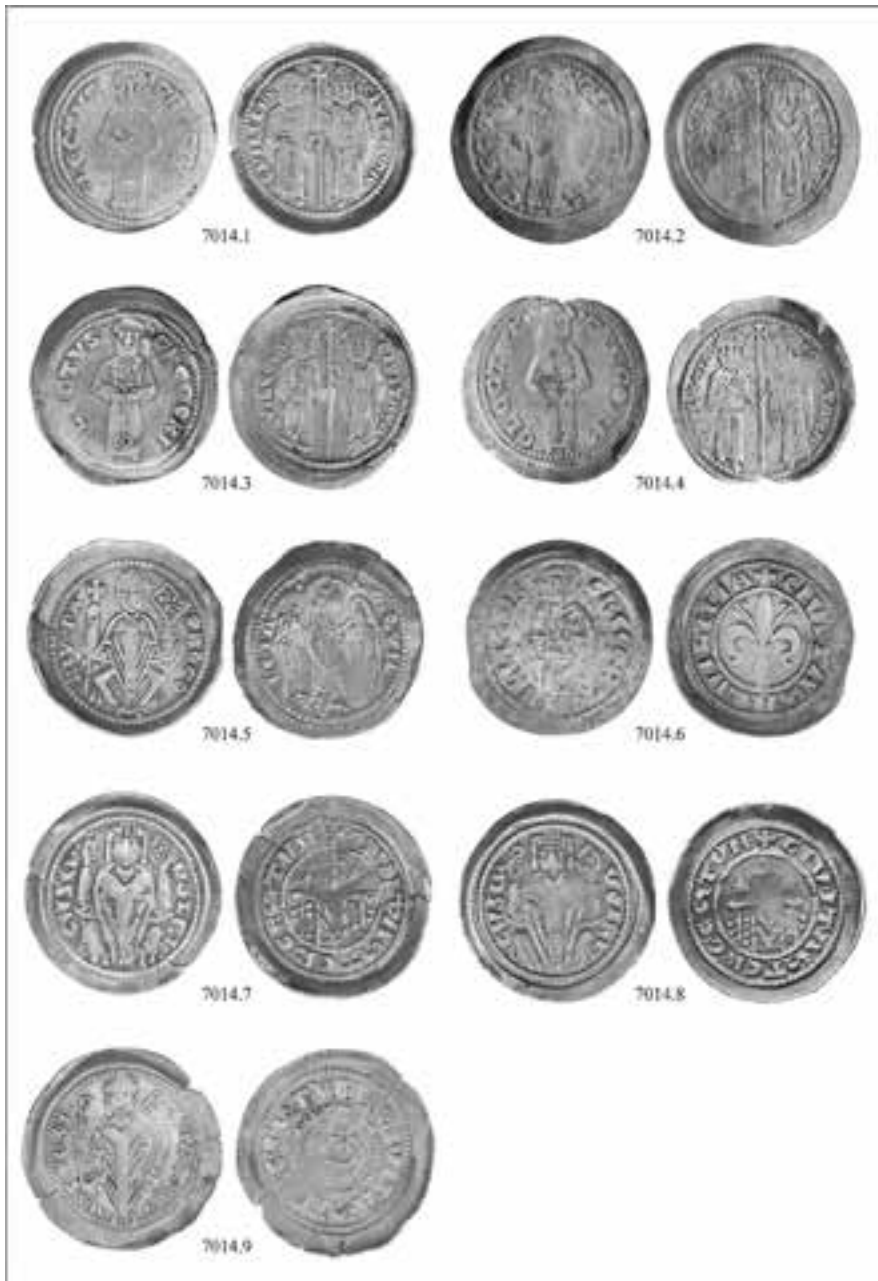
Fig. 6. Loron. Catalogue des monnaies découvertes dans la sépulture 7006