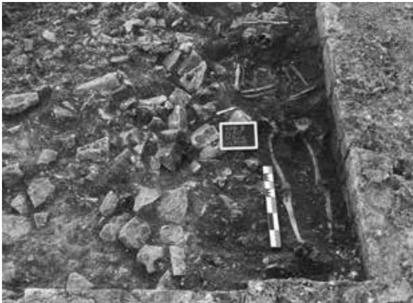
Fig. 3. Loron. Squelette de la sépulture 7006 déposé au fond d'une fosse creusée dans une couche de destruction