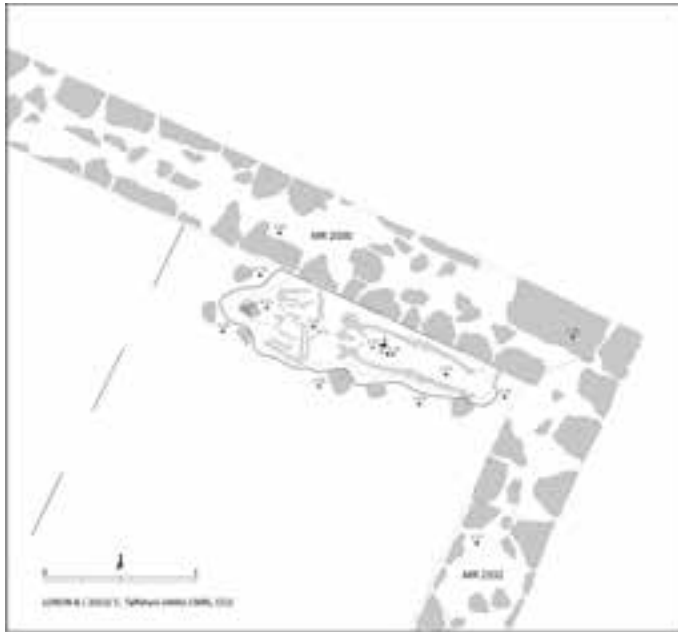
Fig. 2. Loron. Relevé de la sépulture 7006 (DAO C. Taffetani, AMU-CNRS, CCJ)