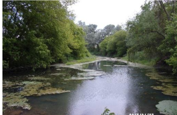
Photographies représentant des lônes. Il était demandé aux répondants d'évaluer s'ils les trouvaient emblématiques et caractéristiques du fleuve et d'identifier ce qu'ils y voyaient

Avec une évaluation moyenne de 5,5/10, elles sont considérées comme plutôt emblématiques du Rhône. Mais cette évaluation est la plus faible des éléments proposés, loin derrière le Rhône canalisé (7,2), les ponts (7,5) ou les vignes (7,3). De plus, les lônes sont mal identifiées par les usagers. Seules 70% des personnes interrogées ont répondu à la question ouverte « selon vous que représentent ces deux photos ? ». Parmi elles, seules 27% ont utilisé le terme « lône » ou « bras mort ». Sans surprise, les riverains du Rhône considèrent les lônes plus emblématiques du fleuve que les non-riverains (évaluation moyenne de 5,8 contre 5,1) et les identifient mieux.