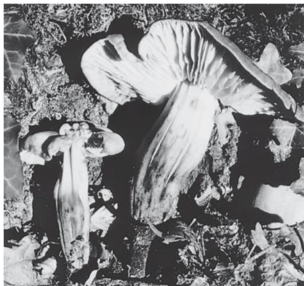
Photo 1 Fructification de Collybie à pied en fuseau. Noter le pied caractéristique : charnu, strié verticalement et terminé à la base par une partie souterraine noire et radicante.

Un examen de la littérature disponible sur ce champignon montre qu'il a déjà été mentionné dans le passé par Buller (1958) et par Kreisel (1961) comme étant un parasite. Néanmoins, pratiquement aucune information sur sa biologie n'est disponible. Un programme de recherche a donc été entrepris pour mieux comprendre le rôle de cet agent de pourridié apparemment fréquent. Plus spécifiquement, nous avons tenté de comprendre quels sont les facteurs qui expliquent la répartition du champignon dans la chênaie, de caractériser son pouvoir pathogène et d'étudier les conséquences pour les arbres de l'infection par la Collybie.