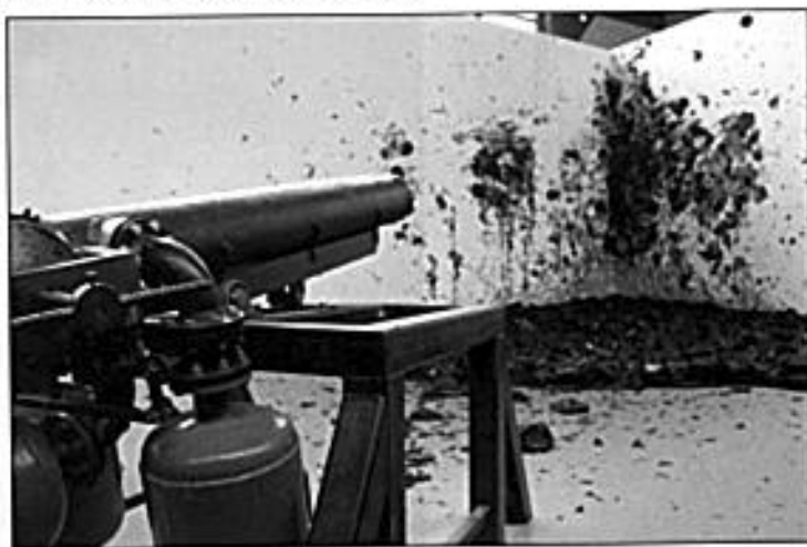
Shooting into the Corner, château de Versailles, 2015. Source: https://www.flickr.com/photos/1292310709@N00/sets/7215766822321220/ (reproduction autorisée sous licence Creative Commons 2.0).

Il prend le parti de les montrer par le biais de l'allusion métaphorique et du détournement. Le canon à pigments actionné par l'artiste ou l'un de ses représentants est filmé en train de projeter dans un coin des charges volumineuses de peinture rouge qui explosent à l'intersection de deux cloisons blanches formant le site de l'exposition. Cette vision de l'histoire se trouve ainsi narrativisée de manière dissidente et détournée de son cours institutionnalisé, puisqu'elle est réécrite dans les imaginaires et mise en circulation sur internet et les réseaux sociaux. Le but poursuivi par l'artiste est clair : rendre aux exclus leur place, aux subalternes le droit à la « parole » 13 et au peuple sa mémoire. Spectacle saisissant de vérité, hallucinant, dérangeant même. Ici, la révolution est à prendre, au pied de la lettre pour ce qu'elle est : la manifestation sublimée d'un pouvoir totalitaire au service des grands principes, mais au grand dam des sentiments.