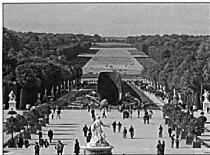
Dirty Corner, jardins du château de Versailles.