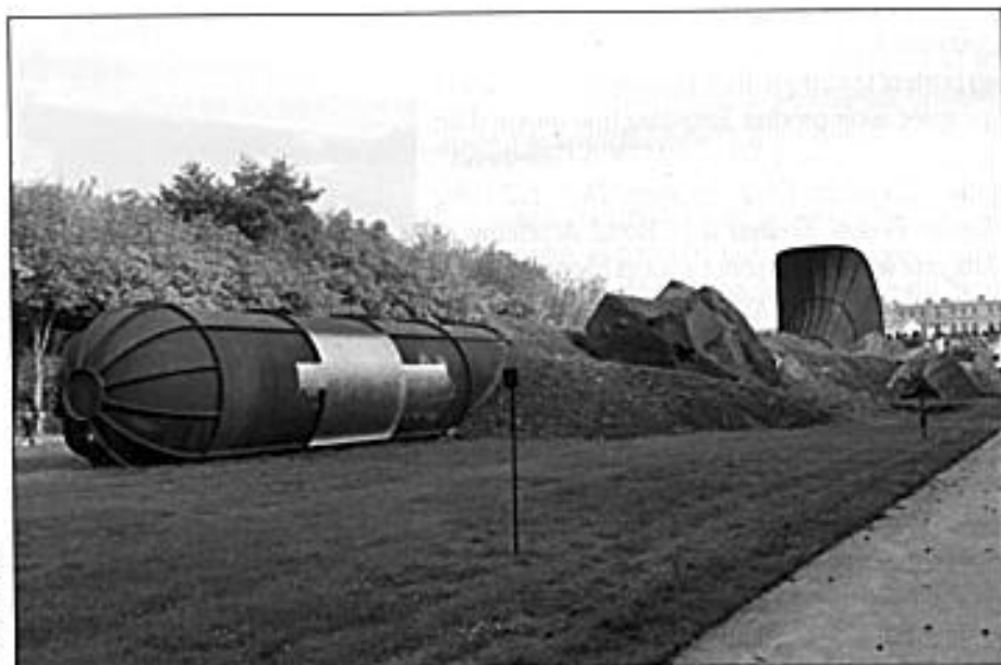
Dirty Corner Photo de Fred Raméno, 24 oct. 2015.

Qu'y a-t-il de plus essentiel que le vide ? Le génie de la langue anglaise l'a bien compris, lui qui désigne par vacuum cleaner un objet du quotidien dont la qualité est de nettoyer grâce au vide. Et ce n'est pas un hasard si, en se retrouvant face à Dirty Corner – une installation monumentale en acier de 60 mètres de long et de 10 mètres de haut, posée au mois de septembre 2015 dans le jardin du Château de Versailles – on se sent assailli par un sentiment de déjà-vu.