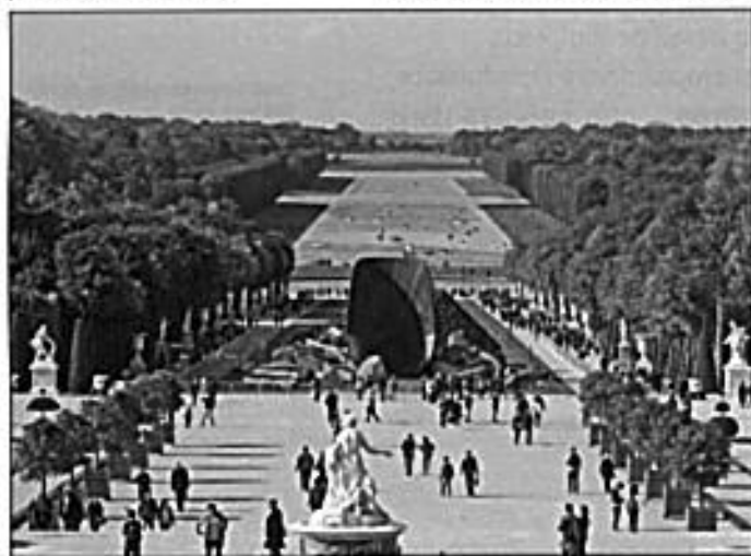
Dirty Corner, jardins du château de Versailles.