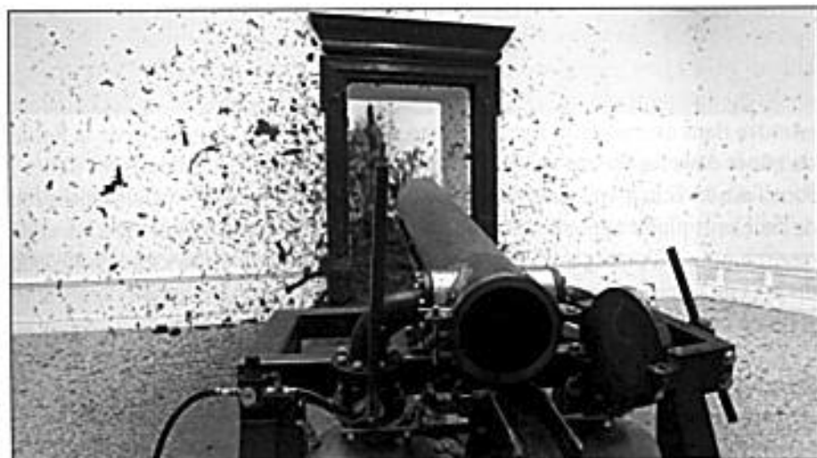
Shooting into the Corner, exposition à la Royal Academy, 2009.