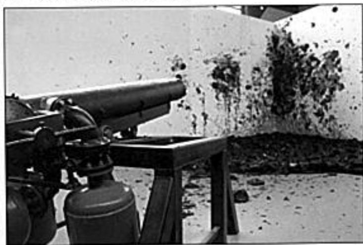
Shooting into the Corner , château de Versailles, 2015. 24 octobre 2015.

Il prend le parti de les montrer par le biais de l'allusion métaphorique et du détournement. Le canon à pigments actionné par l'artiste ou l'un de ses représentants est filmé en train de projeter dans un coin des charges volumineuses de peinture rouge qui explosent à l'intersection de deux cloisons blanches formant le site de l'exposition. Cette vision de l'histoire se trouve ainsi narrativisée de manière dissidente et détournée de son cours institutionnalisé, puisqu'elle est réécrite dans les imaginaires et mise en circulation sur internet et les réseaux sociaux. Le but poursuivi par l'artiste est clair : rendre aux exclus leur place, aux subalternes le droit à la « parole » 13 et au peuple sa mémoire. Spectacle saisissant de vérité, hallucinant, dérangeant même. Ici, la révolution est à prendre, au pied de la lettre pour ce qu'elle est : la manifestation sublimée d'un pouvoir totalitaire au service des grands principes, mais au grand dam des sentiments.