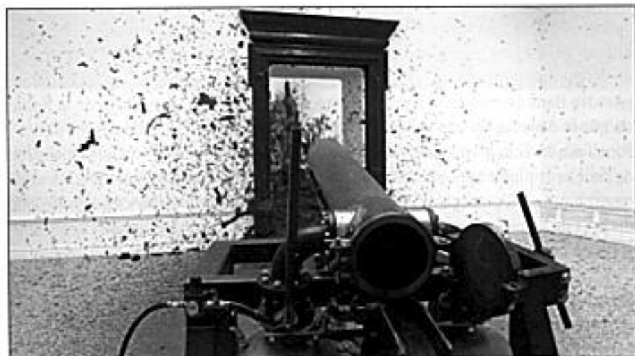
Shooting into the Corner, exposition à la Royal Academy, 2009.