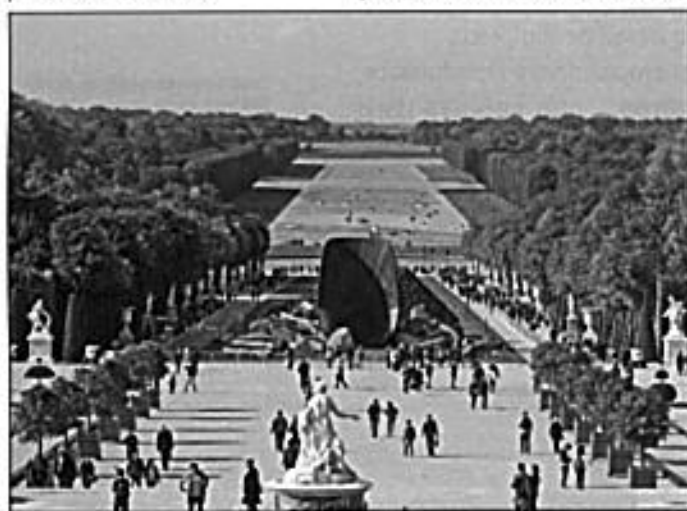
Dirty Corner, jardins du château de Versailles.