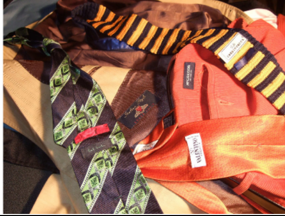
Photo 5 : La profusion des accessoires, des marques et des griffes de luxe Présence des accessoires et diversité des marques, motifs, matières et couleurs