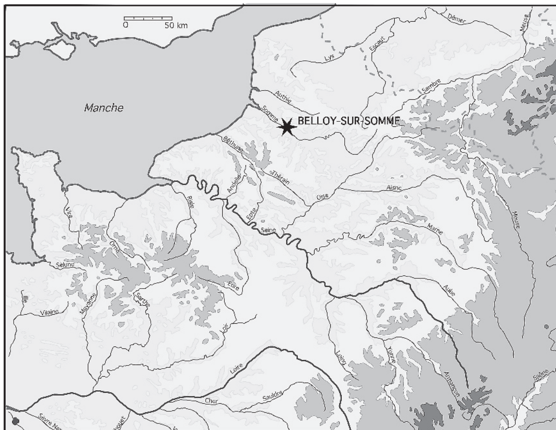
Fig. 1 – Localisation du gisement de la Plaisance à Belloy-sur-Somme. Fig. 1 – Location of « La Plaisance »'s site in Belloy-sur-Somme (France).

Tous les ossements mis au jour à Belloy-sur-Somme ont été découverts à l'occasion des fouilles menées par J.-P. Fagnart dans les deux niveaux les plus récents : « Belloisien » et Mésolithique moyen. Ces campagnes de fouilles ont concerné différents secteurs isolés les uns des autres (fig. 2), explorés sur des surfaces plus