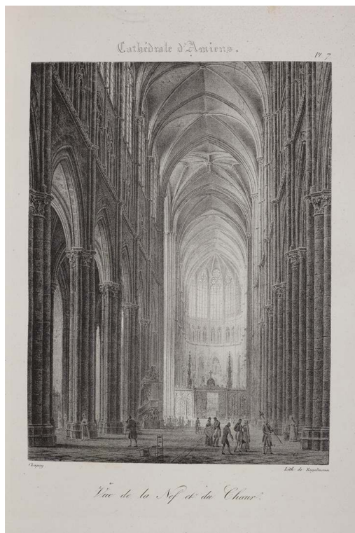
Vues pittoresques de la cathédrale d'Amiens, 1824, pl. 7.