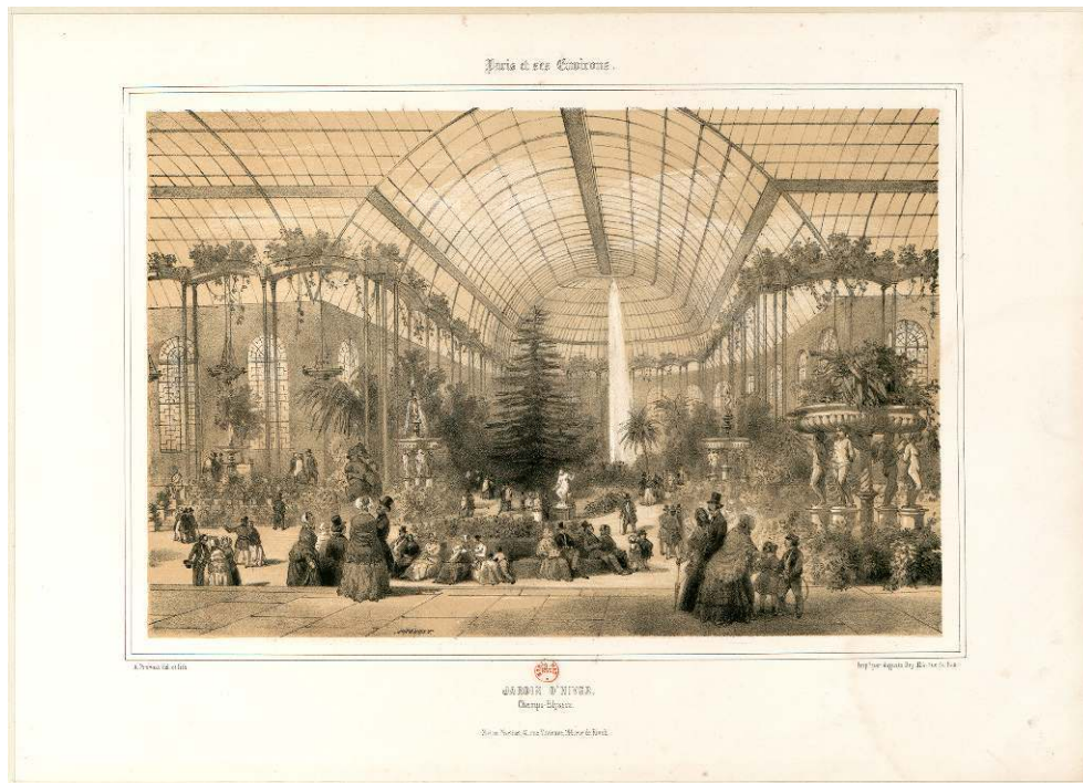
Fig. 3 : A. Provost illustrateur, Jardin d'hiver des Champs-Élysées