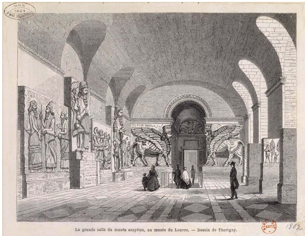
La grande salle du musée assyrien, au musée du Louvre. — Dessin de Thorigny.