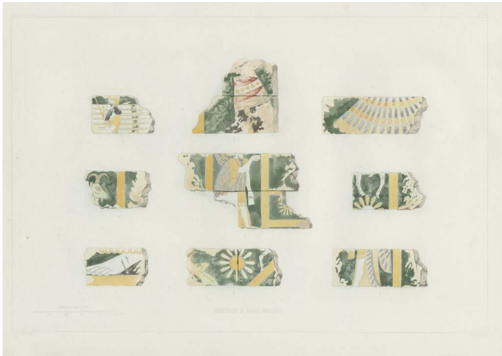
Paul-Émile Botta et Eugène Flandin, Monuments de Ninive , t. 2, 1849, pl. 155.