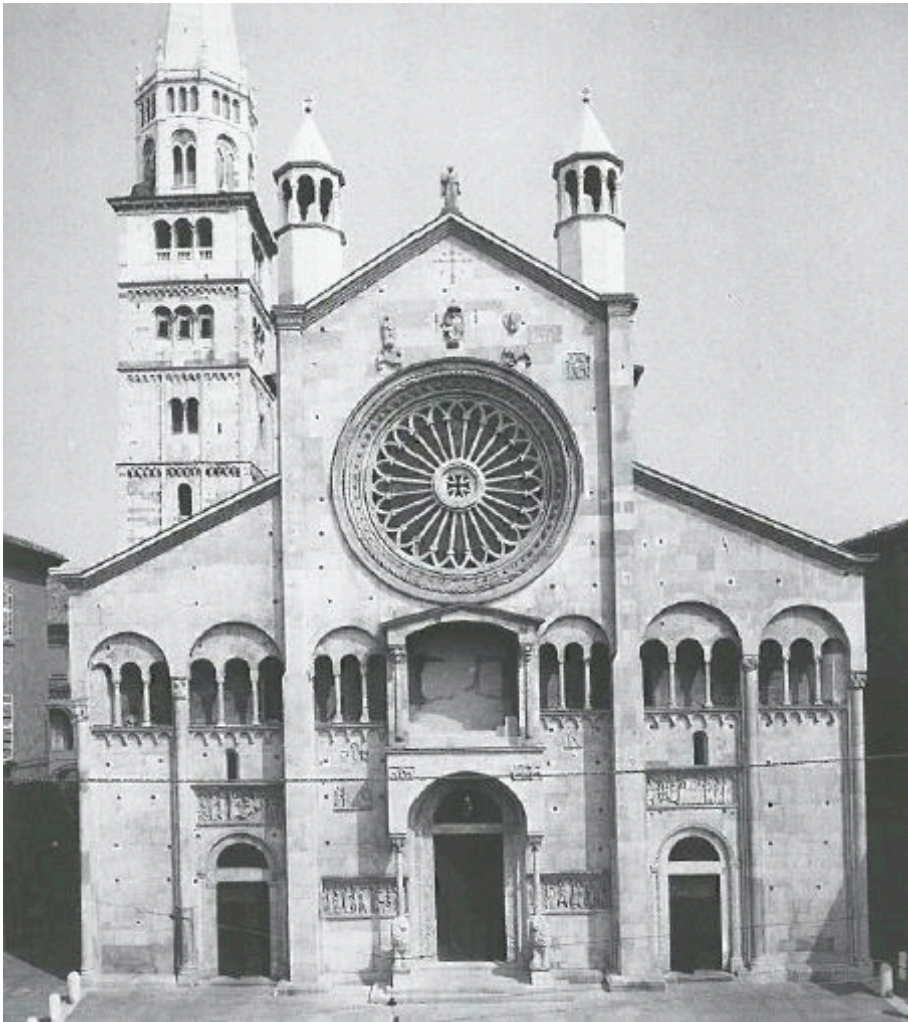
Fig. 5 – Façade de la cathédrale de Modène, XII e siècle.