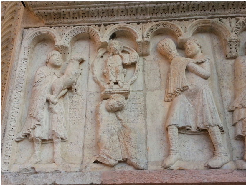
Fig. 7 – Sacrifice d'Abel et de Caïn, façade de la cathédrale de Modène, XII e siècle.