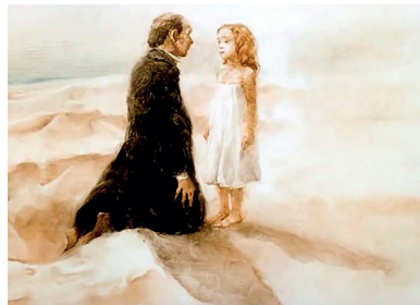
Le Rêve d'un homme ridicule , Aleksandr Petrov, Studios Panorama, 1993, 7'00, capture d'écran