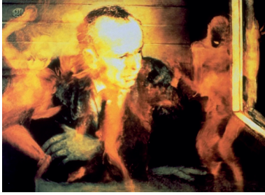
Le Rêve d'un homme ridicule, Aleksandr Petrov, Studios Panorama, 1993, 2'02, capture d'écran

Le potentiel onirique infini de l'animation a compté dans l'orientation de Petrov. En atteste cet extrait de son échange avec la scénariste et romancière russe Elena Dolgopiat pour la revue Kinovedtcheskie zapiski en 2001 :