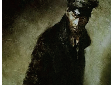
Le Rêve d'un homme ridicule , Aleksandr Petrov, Studios Panorama, 1993, 3'00 et 3'08, captures d'écran

Son sommeil le plonge dans un rêve qui constitue le centre de la nouvelle. La dimension fantastique du récit débute ici. L'homme se représente à lui-même allongé dans sa tombe, après avoir été enterré. Il ressent et perçoit. Une goutte s'écrase à intervalles sur sa paupière gauche. Puis, doucement, comme en flottement, et accompagné d'une sorte de présence, son corps rejoint les airs dans la nuit noire et s'achemine vers un autre astre, une planète dont il reconnaît rapidement les contours puisqu'il s'agit d'une réplique de la Terre. Il s'y achemine et y découvrira l'existence – et donc la possibilité – de la fraternité humaine. Cette Terre n'est pas décrite comme le Paradis au sens chrétien du terme par Dostoïevski. Le lecteur se trouve plongé dans une description de l'Âge d'or, d'une Terre qui n'aurait pas