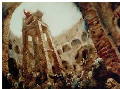
Le Rêve d'un homme ridicule , Aleksandr Petrov, Studios Panorama, 1993, 16'47 et 15'03 puis (page de droite) 16'20 et 17'43, captures d'écran