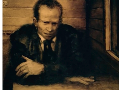
Personnage du narrateur dans les premières minutes du film. Le Rêve d'un homme ridicule , Aleksandr Petrov, Studios Panorama, 1993, l'43, capture d'écran

Concernant le personnage de la fillette, de nombreuses images vidéos ont là encore été tournées avec une petite fille de Iaroslavl ayant servi de modèle à l'enfant de la nouvelle. La petite fille n'est pas un personnage annexe du récit, ou secondaire, Petrov le sait. Il est central, majeur, essentiel.