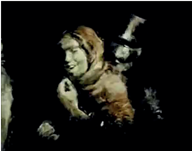
Le Rêve d'un homme ridicule , Aleksandr Petrov, Studios Panorama, 1993, 3'44, capture d'écran

Autre exemple de présence de l'univers dostoïevskien dans son film, lorsque notre personnage fuit la petite fille dans une course haletante, il croise dans la pénombre des rues étroites de Pétersbourg passants, marchands, prostituées, ivrognes, cochers grossiers hélant leurs chevaux. Là encore nul détail visuel n'était donné dans la nouvelle, dans laquelle Dostoïevski écrit seulement : « D'un coup, j'ai eu l'idée que si le gaz s'était éteint partout, ç'aurait été plus gai, que le gaz rendait le cœur triste, parce qu'il éclairait tout. » Il s'agit ici d'une figure parfaitement elliptique. « Le gaz rend le cœur triste car il éclaire tout », et c'est ce « tout » que notre personnage ne veut plus voir, ces rues froides, hostiles et sordides que Petrov se charge en revanche de restituer visuellement , soignant les effets rythmiques et sonores. La fuite en avant du personnage nous plonge sans doute possible dans les errances nocturnes de Raskolnikov ( Crime et Châtiment ), ses descriptions des prostituées, l'ivresse des passants... On entend l'orgue de barbarie, les rires, le bruit. La vie pétersbourgeoise est là, très précisément représentée et rappelant immédiatement les descriptions du roman : la débauche des bas-fonds, leur misère. Une fille décortique des graines de