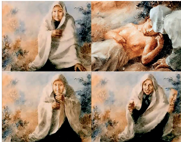
Le Rêve d'un homme ridicule , Aleksandr Petrov, Studios Panorama, 1993, de 12'18 à 12'25, captures d'écran

Comme dit précédemment, le début du chaos est symbolisé dans le film par un masque exprimant la duperie. Le narrateur s'est revêtu d'un fichu de femme et s'est masqué. Il s'est en somme déguisé en femme et s'approche d'une adolescente (en qui l'on devine la petite fille, qui a grandi), la poitrine découverte, qui lui sourit avec toute la tendresse et l'innocence du monde. Soudain, le narrateur enlève le masque et rit de sa supercherie : il se moque et offense la confiance de la jeune femme. On retrouve ici le thème de l'offense à la Terre-Mère évoqué par Motchoulski dans son analyse de la nouvelle. Le doute s'immisce pour la première fois dans les yeux de la jeune femme, la méfiance, la peur. C'est alors que l'araignée vient s'immiscer le long du bras du narrateur, annonce de l'arrivée du Mal. Le chien, si bon, se met à grogner, se fait menaçant. Et la femme devient, en quelques plans, tentatrice et lubrique. « Dans le paradis sur terre, le mal pénètre sous l'aspect d'une lubricité meurtrière », écrivait Motchoulski.