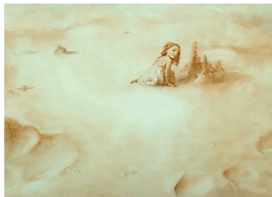
Le Rêve d'un homme ridicule , Aleksandr Petrov, Studios Panorama, 1993, 7'02 et 6'43, captures d'écran