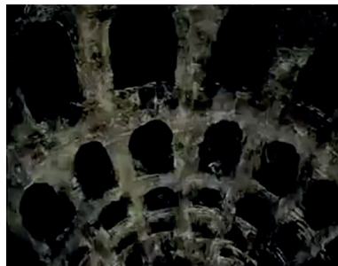
Le Rêve d'un homme ridicule, Aleksandr Petrov, Studios Panorama, 1993, 4'56, 5'05, 5'14 et 5'18, captures d'écran