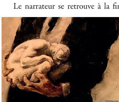
Le Rêve d'un homme ridicule, Aleksandr Petrov, Studios Panorama, 1993, 18'07, capture d'écran

Nulle fantasmagorie débridée dans la nouvelle elle-même, de même que l'aspect fantastique se limite au procédé du voyage imaginaire. Les aspects mystiques sont également peu présents de manière explicite, de même que les conduites excentriques (exception faite du fameux capitaine) ou l'évocation des bas-fonds : Petrov les crée et les insuffle de toute pièce, notamment dans le passage de l'accélération du chaos. Dans La Poétique de Dostoïevski , Bakhtine écrit sur la nouvelle : « L'argumentation méthodique tant soit peu développée est totalement absente. C'est un exemple frappant de l'aptitude exceptionnelle de Dostoïevski [...] à voir et à sentir artistiquement l'idée. Nous avons affaire ici à une authentique peinture de l'idée. » Il souligne le grand laconisme du texte, typique de la Ménippée. Petrov, précisément, figure les silences du texte, puisant dans les racines les plus profondes de l'univers symbolique et référentiel dostoïevskien.