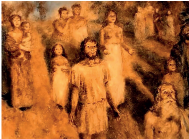
Le Rêve d'un homme ridicule, Aleksandr Petrov, Studios Panorama, 1993, 10'24 et 10'52, captures d'écran

Débutent de longues séquences évoquant l'Âge d'or dans son iconographie classique (Pierre-Charles Trémolières et Nicolas Delobel, Léonard de Vinci). Les tonalités de couleur comme la facture choisies incitent à penser que Petrov a voulu rapprocher son dessin des représentations Renaissance et XVIII e siècle à la sanguine du mythe. Cet aspect renvoie à nouveau aux analyses bakhtiniennes du texte, que Petrov a sans doute possible lues et étudiées avec précision. Bakhtine a en effet notamment mis en évidence l'importance de l'héritage antique du point de vue du genre chez Dostoïevski (Dostoïevski n'a rien à voir, plaide-t-il longuement, avec ses contemporains du point de vue du genre – son œuvre a d'autres origines, d'autres procédés, d'autres fins). La nouvelle conforte cette analyse. Il écrit d'ailleurs à son propos : « D'une façon générale, ce n'est pas l'esprit chrétien mais celui de l'Antiquité qui est mis en avant dans Le Rêve d'un homme ridicule 55 ».