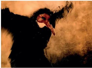
Le Rêve d'un homme ridicule , Aleksandr Petrov, Studios Panorama, 1993, 13'57, capture d'écran

Considéré par le critique A. Orlov comme « le plus profond des films de Petrov », Le Rêve d'un homme ridicule est surtout une œuvre déployant un monde imaginaire foisonnant, mystique et troublant, où le texte concis et laconique de Dostoïevski devient le ferment d'une inventivité visuelle et d'une mise en scène magistrales.