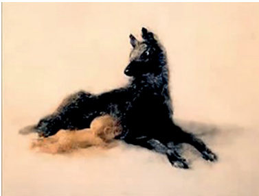
Le Rêve d'un homme ridicule , Aleksandr Petrov, Studios Panorama, 1993, 8'12, 9'02 et 10'13, captures d'écran

Soudain, un vieil homme lave les pieds du narrateur (symbole biblique d'amour et de transformation de la pyramide humaine en un corps ; cf. le lavement des pieds des Apôtres par Jésus au dernier repas précédant sa Passion). Un chien avenant et gai vient également nous rappeler ce qu'écrit Dostoïevski sur l'union profonde qui unit hommes et animaux.