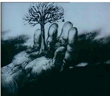
Figure 6 : L'Arbre de la patrie de Vladimir Petkevitch, 1987, Sverdlovskaja kinostoudia, 5'59, capture d'écran

grecs, ces essences réalisées qui répondent de la construction juste du monde.