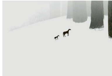
Figure 11 : Le cheval redevenu enfant et sa mère, Le Garçon , Dmitri Gueller, 2008, Studio A-Film, 14'32, capture d'écran

Le Garçon [ Mal'čik ] (2008), en papiers découpés, inspiré de la nouvelle Kholstomer de Lev Tolstoï, présente les derniers instants d'un vieux cheval, qui grâce à une dernière vision onirique revient à l'état bienheureux d'enfant auprès de sa mère. La sobriété du dessin, le jeu entre le noir/gris, symbolisant la mort et ses souffrances, et le blanc vif de la vision, la musique de John Zorn, d'une très