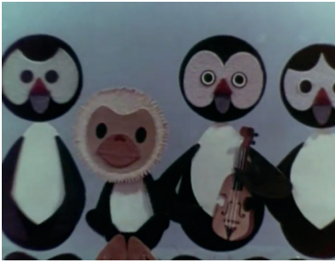
Figure 3 : Le ouistiti et les pingouins Le Ouistiti et les Archets , d'Anatoli Aliachev et Valéri Fomine, 1970, Sverdlovskaja kinostoudia, 3'17, capture d'écran

il condamne le conformisme de professeurs d'une école de musique très classique. Les musiciens sont des pingouins, mais un ouistiti se présente au concours d'entrée au conservatoire, en jouant une musique légère, presque de variétés. Il est finalement éjecté du concours et envoyé au zoo, mais sa musique demeure. Ce film est un exemple de la manière dont les réalisateurs pouvaient faire une critique discrète de l'imposition de règles strictes dans le domaine de la création. L'hétérogénéité du personnage par rapport au groupe des pingouins est frappante et fait penser au personnage de Tchébourachka, petit être non identifié et personnage du film Crocodile Guéna [ Krokodil Gena ] (1969), sorti une année avant ce film. C'est en tout cas cet outsider qui apportera du renouveau dans un univers figé, ce qui n'est pas le moindre des messages.