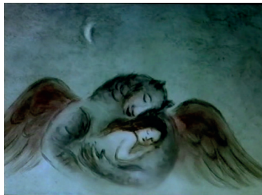
Figure 10 ; Les Écrevisses , Valentin Olchvang, 2003, Studio d'animation de Sverdlovsk A-Film, 5'35, capture d'écran

Depuis le soir il pleut... [ So večora doždik ] (2009), adaptation d'un conte d'Alekseï Tolstoï, illustre à la fois un proverbe russe mis en exergue au début du film, « ni diable, ni homme » [ ot čërta otstal, a k ljudjam ne pristol ], et l'atmosphère d'une berceuse (celle du titre). Un pêcheur trouve dans ses filets une petite sirène, qu'il recueille, mais elle le tue et l'entraîne dans son monde, c'est-à-dire dans l'eau. Nous sommes ici dans un entre-deux, comme pour le film précédent : les personnages « démoniaques » ne le sont pas tout à fait (c'est la mère de l'humaine qui provoque le malheur et non le dragon, la sirène donne du bonheur au pêcheur