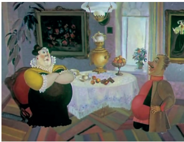
Figure 1 – La barynia et son intendant La Cache herbue de Valéri Fomine, Sverdlovskaja kinostoudia, 12'39, capture d'écran

L'école de l'Oural a un rapport privilégié à la littérature 3 . Valéri Fomine (né en 1939), l'autre grand maître de cette génération et ami d'Anatoli Aliachev, a adapté plusieurs contes du célèbre écrivain de la région, Pavel Bajov. La richesse des monts Oural en pierres précieuses est l'axe thématique de la majorité de ces films, et les héros, chercheurs de pierres ou de trésors, affrontent des êtres légendaires. Fomine est un peintre professionnel, mais c'est également un homme de théâtre (il a travaillé plusieurs années au théâtre de marionnettes de Sverdlovsk puis à celui de la ville de Krasnotourinsk), et la mise en scène, le mouvement des personnages sont donc pour lui aussi importants que l'aspect purement esthétique du dessin, et il travaille aussi bien en dessin qu'avec des marionnettes. Pour ses adaptations