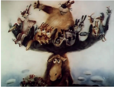
Figure 5 : Les deux univers l'un au-dessus de l'autre Bienvenue , d'Aleksei Karaev, 1986, Sverdlovskaja kinostoudia, 9 min. 08, capture d'écran

par oublier leur bienfaiteur, mais l'élan, à la façon d'un Don Quichotte, commence à se sentir responsable pour eux. Ayant oublié que c'était la période de la mue, il se désole quand tous tombent par terre au moment où il perd ses bois, et sa dernière réplique est à la fois triste et ironique : « Ce n'est quand même pas très correct » 7 .