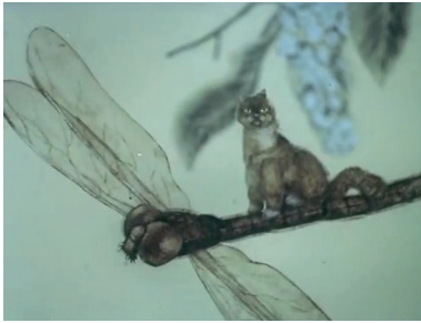
Figure 4 : Le moineau imagine le chat volant sur une libellule Le Petit Moineau , Alekseï Karaïev, 1984, Sverdlovskaja kinostoudia, 6'44, capture d'écran

Alekseï Karaev a une formation d'architecte, il sait donc se servir d'un crayon et a une manière de penser spatiale. Ces qualités seront décisives quand il se présentera (et sera admis) en 1979 aux cours supérieurs de scénaristes et de réalisateurs. Comme ses collègues, le futur réalisateur aura la chance d'y rencontrer deux maîtres – Fedor Khitrouk et Youri Norstein. Karaev est lui aussi un maître de l'adaptation – le littératurocentrisme évoqué supra a eu une influence sur presque tous les cinéastes d'animation de l'Oural –, en premier lieu de la littérature jeunesse. Dès son premier