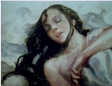
Figure 7 La Sirène d'Aleksandr Petrov, 1996, Kinocompania DAGO, Studios Char, Studio Panorama (Iaroslavl), 1'56, capture d'écran

On trouvera les thèmes du sacrifice, de la foi, de la tentation dans les films suivants de Petrov – La Sirène [ Rusalka ] (1996), dans lequel un vieux moine sauve au prix de sa mort un jeune moine du pouvoir maléfique d'une sirène, l'amoureuse qu'il avait trahie dans sa jeunesse 12 , Le Songe d'un homme ridicule [ Son smešnogo čeloveka ] (1992), adapté de Fedor Dostoïevski et Mon amour , où un lycéen de quinze ans découvre l'amour.