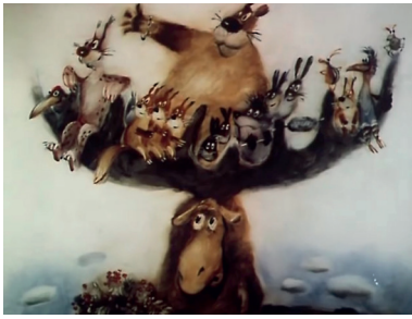
Figure 5 : Les deux univers l'un au-dessus de l'autre Bienvenue , d'Aleksei Karaev, 1986, Sverdlovskaja kinostoudia, 9 min. 08, capture d'écran

par oublier leur bienfaiteur, mais l'élan, à la façon d'un Don Quichotte, commence à se sentir responsable pour eux. Ayant oublié que c'était la période de la mue, il se désole quand tous tombent par terre au moment où il perd ses bois, et sa dernière réplique est à la fois triste et ironique : « Ce n'est quand même pas très correct » 7 .