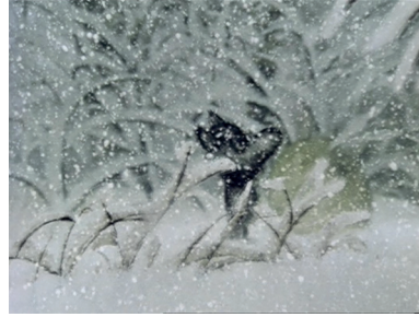
Figure 2 Le Conte des contes , Norstein Youri, Soiouzmultfilm, 1979, 25'31, capture d'écran

Ces motifs, toujours très présents dans les films de Norstein, permettent au spectateur d'accéder à des « nœuds » de tension dramatique, où se confrontent, au niveau plastique, l'immersif et l'intensif, le coloris ambiant et le foyer de couleur. Les motifs enveloppants contrastent avec les foyers des territoires refuges (la cabane de bois dans La Renarde et le Lièvre [ Lisa i zajac ], le coin du feu de la masure du petit loup dans Le Conte des contes , l'abri de l'ours dans Le Petit Hérisson dans le brouillard ). Les lieux d'intimité, de couleurs vives et chaudes, s'opposent aux opacités blanches et grises des atmosphères de neige, de glace, de brouillard, de plan d'eau et de pluie. Le feu de camp du Conte des contes et la lampe dans le plan de fin du Petit Hérisson dans le brouillard brillent des mêmes jaunes étincelants et rouges orangés. Le feu crépitant du Conte des contes se démarque de la grisaille ambiante (rouille et vert-de-gris), des halos de lumière réflexifs et des plans de neige opaques. La lampe chaude du Petit Hérisson dans le brouillard , autour de laquelle virevoltent des lucioles, s'oppose aux milieux oppressants du brouillard, uniformément blancs et cotonneux, et du plan d'eau en clair-obscur.