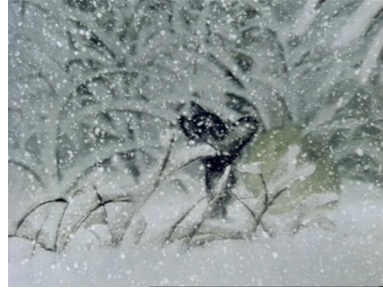
Figure 2 Le Conte des contes , Norstein Youri, Soiouzmultfilm, 1979, 25'31, capture d'écran

Ces motifs, toujours très présents dans les films de Norstein, permettent au spectateur d'accéder à des « nœuds » de tension dramatique, où se confrontent, au niveau plastique, l'immersif et l'intensif, le coloris ambiant et le foyer de couleur. Les motifs enveloppants contrastent avec les foyers des territoires refuges (la cabane de bois dans La Renarde et le Lièvre [ Lisa i zajac ], le coin du feu de la masure du petit loup dans Le Conte des contes , l'abri de l'ours dans Le Petit Hérisson dans le brouillard ). Les lieux d'intimité, de couleurs vives et chaudes, s'opposent aux opacités blanches et grises des atmosphères de neige, de glace, de brouillard, de plan d'eau et de pluie. Le feu de camp du Conte des contes et la lampe dans le plan de fin du Petit Hérisson dans le brouillard brillent des mêmes jaunes étincelants et rouges orangés. Le feu crépitant du Conte des contes se démarque de la grisaille ambiante (rouille et vert-de-gris), des halos de lumière réflexifs et des plans de neige opaques. La lampe chaude du Petit Hérisson dans le brouillard , autour de laquelle virevoltent des lucioles, s'oppose aux milieux oppressants du brouillard, uniformément blancs et cotonneux, et du plan d'eau en clair-obscur.