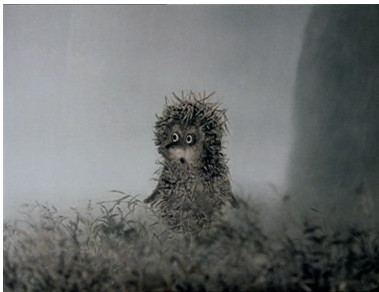
Figure 1 – Le Petit Hérisson dans le brouillard , Norstein Youri, Soïouzmoultfilm, 1975, 5'35, capture d'écran

Sur le plan paysager, ces motifs narratifs recourent des zones blanches, à l'écart des voies toutes tracées, ou des zones grises, caractérisées par ce que le peintre Paul Klee prête au « point gris 20 », un lieu d'émergence du chaos. Ces espaces rabattent le jeu des lignes savantes du paysage (lignes d'horizon, de perspective, de fuite) sur un fond matériologique et sur un milieu météorologique, sur des voies