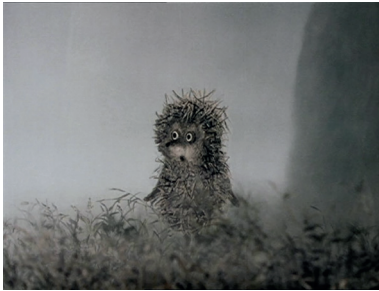
Figure 1 – Le Petit Hérisson dans le brouillard , Norstein Youri, Soiouzmoultfilm, 1975, 5'35, capture d'écran

Sur le plan paysager, ces motifs narratifs recourent des zones blanches, à l'écart des voies toutes tracées, ou des zones grises, caractérisées par ce que le peintre Paul Klee prête au « point gris 20 », un lieu d'émergence du chaos. Ces espaces rabattent le jeu des lignes savantes du paysage (lignes d'horizon, de perspective, de fuite) sur un fond matériologique et sur un milieu météorologique, sur des voies d'esquisse et des territoires de textures. Le film Le Petit Hérisson dans le brouillard s'organise tout entier autour de ces deux polarités des zones blanches et des zones grises, avec les séquences de brouillard d'un côté et les différentes scènes de contact du hérisson avec les milieux végétaux, les écorces d'arbre et les pièces d'eau, de l'autre.