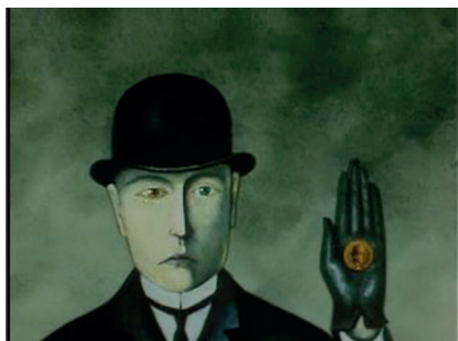
Figure 1 - Le Diable jaune de l' Harmonica de verre .

Andrei Khrjanovski, L'Harmonica de verre , 1968, 4'07. DVD Masters of Russian Animation , (DVD : 1h24'24), capture d'écran.