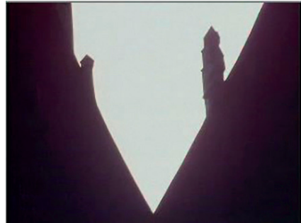
Figure 3 - L'éclair de lumière à la fin Andrei Khrjanovski, L'Harmonica de verre , 1968, 6'52. DVD Masters of Russian Animation , (DVD : 1h37'09), capture d'écran.

L'espace transformé par l'harmonica perd son essence d'espace qui rend claustrophobe caractéristique de la cité opprimée ; un large ciel ouvert et clair symbolise la liberté, qu'aucune force ne peut dompter. Le motif du ciel bleu infini est récurrent dans le film – du moment où l'enfant cueille la fleur en arrière-plan (héritage de l'harmonica de verre) au magnifique ciel quand il quitte la cité pour un horizon plus clair.