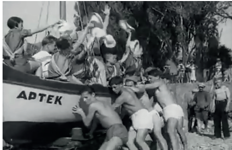
Le Nouveau Gulliver , Aleksandr Ptouchko, Moskinikombinat, 1935, 5 '09. Capture d'écran.

Il ne faut donc pas se cantonner à un examen superficiel du film, mais essayer d'en démêler l'imbroglio. Plusieurs aspects me semblent notables et méritent attention, à commencer par son ouverture, annonce explicite d'une revisitation radicale du thème swiftien à l'aune du présent soviétique. Celle-ci installe en effet le spectateur, à la manière d'un documentaire, dans ce qui pourrait être une scène contemporaine de l'Union soviétique des années 1930. Un groupe d'une douzaine de jeunes pionniers léninistes, scouts de la mer comme dit leur chanson, rejoint martialement, aux paroles entraînantes du chant, d'autres groupes rassemblés sur un rivage. L'atmosphère est à l'allégresse.