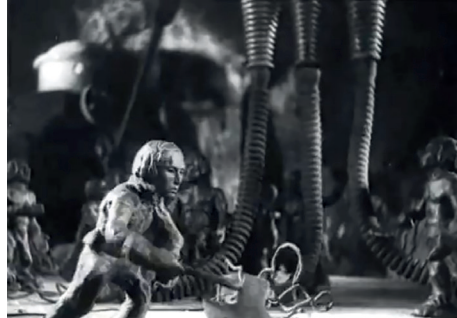
Le Nouveau Gulliver , Aleksandr Ptouchko, Moskinkombinat, 1935, 41'12. Capture d'écran.

sous terre. Les silhouettes semblent faites de glaise. Ce sont des corps masculins musculeux, légèrement brillants, cependant asexués. Certains portent des casques. À la différence des Lilliputiens de la cité extérieure, leurs visages sont peu différenciés entre eux. Ils font corps, chromatiquement et formellement, avec les entrailles de la terre. Ce sont des enfants de la terre, presque assimilés par la mise en scène, qui focalise l'éclairage au centre du plan et repousse les contours d'obsidienne des stalactites dans le flou du fond de champ, à un groupe d'hommes primitifs, assemblés mystérieusement pour se livrer à quelque rituel nocturne. Ils font aussi irrésistiblement penser, par le réalisme accentué de leur anatomie, le caractère fort et volontaire de leurs corps, la détermination de leurs visages, comme taillés à la serpe (ou à la faucille), aux ensembles de sculptures réalistes-socialistes, symboliques de l'ouvrier triomphant.