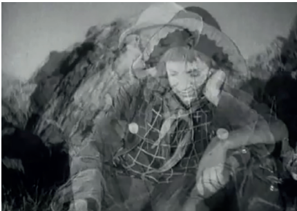
Le Nouveau Gulliver , Aleksandr Ptouchko, Moskinikombinat, 1935, 8'15. Capture d'écran.

Pour le second, il est moins mensonger dans la mesure où l'alphabétisation, l'un des objectifs premiers de la révolution, avait nettement progressé dès les années 1930. Le premier décrochage du réel se produit ainsi, précisément, après que le groupe eut approuvé (démocratiquement) la proposition du chef instructeur de procéder à une lecture collective de Swift. Sa voix off restitue fidèlement les lignes d'ouverture du classique jusqu'au premier épisode du naufrage : le film prend ainsi en compte la dimension éducative prônée par le réalisme socialiste (pas seulement par lui, à vrai dire), mais il y introduit la présence de pirates, responsables de l'accident du navire sur lequel vogue Gulliver, l' Antilope ... Pétia, assis, porté par la voix, a fermé les yeux, et le spectateur peut constater qu'à son uniforme de pionnier se sont substitués un vêtement plus ancien et un bicorne, tandis que dans un plan alterné la course des nuages au-dessus de l'îlot s'accélère, dans un mouvement droite-gauche, inverse de celui de la lecture occidentale.