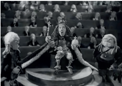
Le Nouveau Gulliver , Aleksandr Pouchko, Moskinkombinat, 1935, 18'00. Capture d'écran.

De ce point de vue, la séquence qui succède à la découverte de l'Homme-Montagne, qui révèle le Parlement lilliputien présidé par le roi, où s'agitent près de 300 marionnettes, est un morceau d'anthologie. Elle est totalement théâtralisée. L'ouverture et la fermeture au noir jouent le rôle de rideau s'ouvrant puis se refermant sur la scène solennelle d'un amphithéâtre, qui ressemble à un cirque, instantanément ridiculisé par la pompe de la musique d'accompagnement, presque funèbre, qui se révélera être le thème musical de l'hymne de Lilliput.