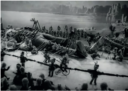
Le Nouveau Gulliver , Aleksandr Ptouchko, Vladimir Konstantinov, Moskinikombinat, 1935, 14'50. Capture d'écran.