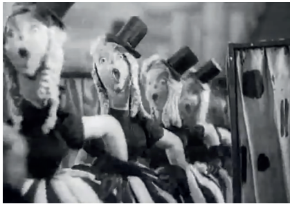
Le Nouveau Gulliver , Aleksandr Ptouchko, Moskinikombinat, 1935, 39'37. Capture d'écran.

Gulliver se scandalise et exige des explications. Après un quiproquo inénarrable – où il apparaît que la notion de peuple est inconnue du chef de la police –, ce dernier tente de calmer la colère de Pétia en faisant chanter la gloire de Lilliput par une vieille cantatrice maniérée, dont les paroles proclament : « Sous la sage direction du roi, la terre s'épanouit, les champs regorgent et nous chantons, notre peuple est heureux dans sa vie, ce sont toujours des chants et jamais de larmes. Nous ne connaissons pas de tourments. »