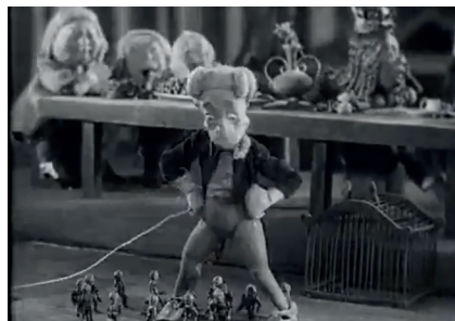
Le Nouveau Gulliver , Aleksandr Ptouchko, Moskinikombinat, 1935, 41'12. Capture d'écran.

Mais le spectacle prend une tournure dangereuse lorsque le maître de cérémonie propose une nouvelle attraction : un spectacle de... nains ! Il y a toujours plus petit que soi et, pour prouver l'adage, le maître de cérémonie se prend trop à son jeu de géant : il fouette la quinzaine de nains danseurs, engagés, pour augmenter leur entrain.