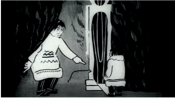
Figures 1 a, b et c

Au sein du combat entre l'ancien et le nouveau, Le Petit Samoyède met en scène l'opposition entre le chamane (présenté dans les intertitres comme « chamane-sorcier » [ šaman-koldun ]) et le progrès moderne, ici incarné par les livres (puis la radio) et la rabfak des peuples du Nord. Le chamane est représenté comme un koulak , uniquement intéressé par les possessions terrestres, et comme un illusionniste truqueur. La séance chamannique existe en effet grâce aux trucs que le chamane exerce tout en exploitant Tchou : dans les « coulisses » (derrière un rideau), il ordonne au petit Samoyède de faire fonctionner le mécanisme qui assure l'illusion (une statuette en mouvement). Mais, pour se venger de l'injustice faite à sa famille, Tchou soulève le rideau et surgit sur la « scène », effrayant les « spectateurs » et ridiculisant le chamane. Il révèle la mécanique de l'illusion dans un espace qui a toutes les apparences d'un théâtre. Grâce à un montage alterné entre les coulisses et la scène, le spectateur du film découvre le stratagème avant le « public » qui assiste au « spectacle ». La mise en scène insiste ainsi sur l'éducation des autochtones autant que sur celle des spectateurs de cinéma. Face au faiseur de prodiges fabriqués, le film oppose la rabfak , futur Institut des peuples du Nord 47 , qui représente l'éducation et la science modernes et « universelles ».