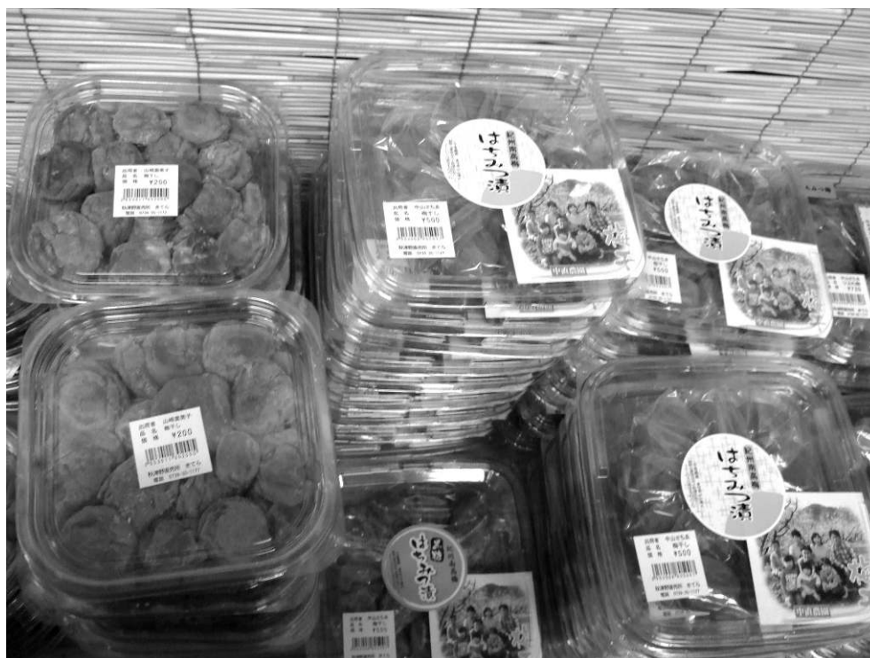
Photo 2 : Prunes salées en vente à Akinotsu/Sales of salted prunes in Akinotsu