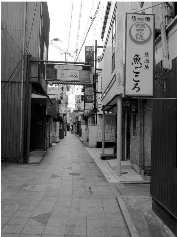
Photo 3 : Le quartier des izakaya-ya à Kii Tanabe / The izakaya-place in Kii Tanabe