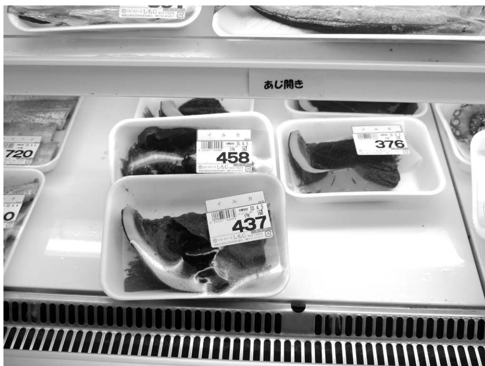
Photo 1 : Barquettes de chair de dauphin ( iruka ) dans une supérette à Ukegawa/ Dolphin meat in a supermarket in Ukegawa