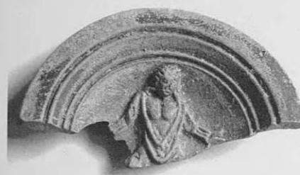
Fig. 2. Lampe mise au jour lors de la fouille du collecteur de Cumae (CA 300 029).