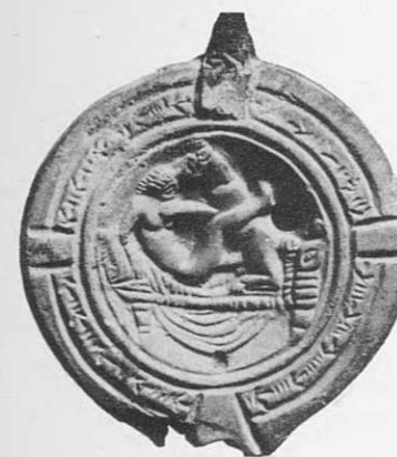
Fig. 4. Photographie de la lampe représentant l'accouplement de Lucien transformé en âne avec la matrone (Lampe du Musée National d'Athènes, n° 3132, d'après Bruneau 1965a).

Le problème qui subsiste, et Philippe Bruneau l'a souligné, il y a déjà quarante ans, est celui de la chronologie. C'est d'ailleurs une question qui intéresse les chercheurs depuis longtemps 10 . L'interprétation de la scène du médaillon se fonde sur Les Métamorphoses d'Apulée, œuvre datée de la deuxième moitié du II e siècle de notre ère (vers 170). L'œuvre de Lucien dont Apulée s'est inspiré, a été écrite dans la deuxième moitié du I er siècle de notre ère. Or notre lampe remonte à la période julio-claudienne et provient d'un contexte de la première moitié du I er siècle de notre ère. On doit en conclure que les œuvres d'Apulée et de Lucien ne sont pas les textes originaux des aventures de Lucius 11 et, de fait, les exégètes considèrent qu'ils sont des imitations d'une œuvre grecque antérieure attribuable à Lucius de Patras 12 , elle-même inspirée d'une œuvre d'Aristide de Milet 13 .