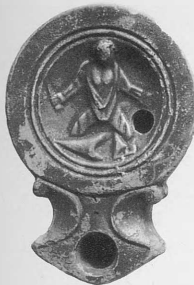
Fig. 3. Lampe conservée au Musée de Trèves (d'après Goethert-Polaschek 1985).