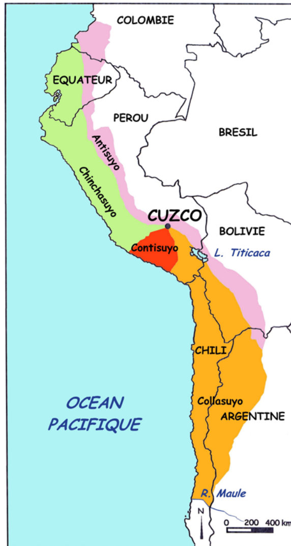
Fig.1: Carte du Tawantinsuyu avec une division approximative des quatre suyus