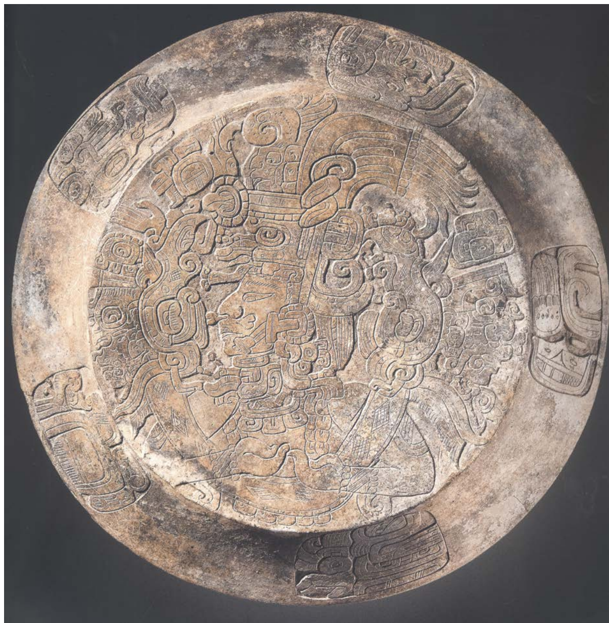
Annexe 1 : photographie de l'objet 66 de l'ancienne collection Vanden Avenne.