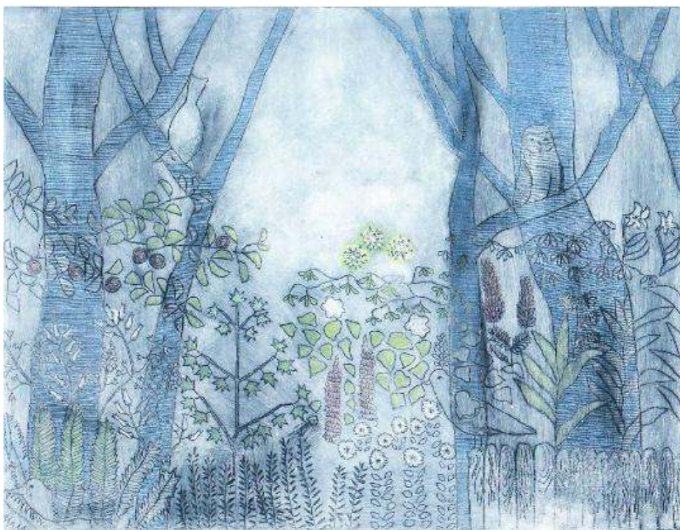
Figure 2. « Spreewald. Eau forte ».