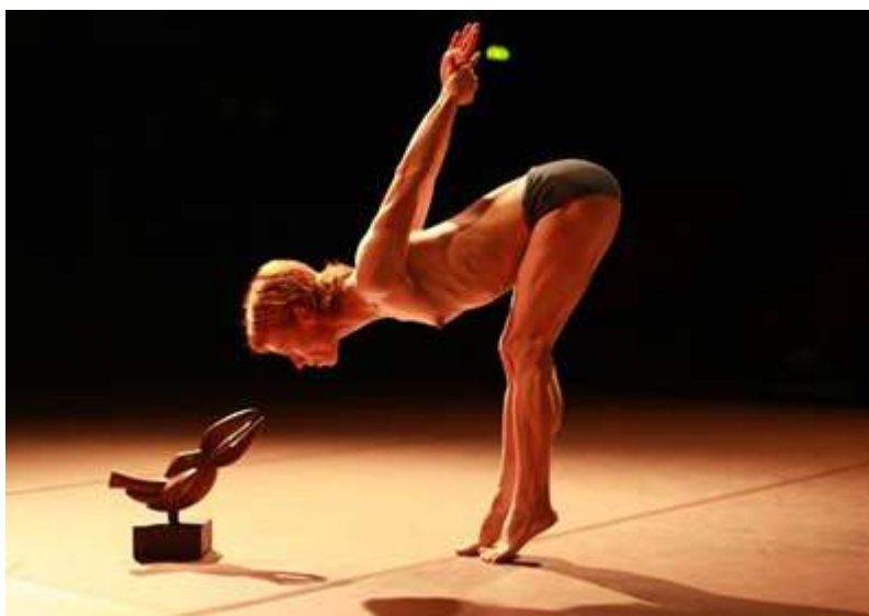
Photographie d'Antoine Conjard, source : Lanabel, 2015.