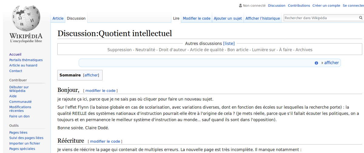
Figure 1: Page de discussion associée à l'article de Wikipédia sur le "Quotient intellectuel"

Néanmoins, toutes les versions de Wikipédia associent systématiquement à chaque article un espace de discussion. La Figure 1 illustre ce type d'espace de discussion appelé "page de discussion" et rendu accessible par un onglet juxtaposé à celui donnant accès à l'article (au dessus du titre "Discussion:Quotient intellectuel")