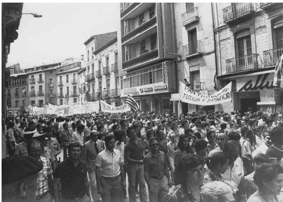
2. Manifestation à Huesca « Pour une gestion démocratique des ressources naturelles », 27 juin 1976.

détournement de l'Èbre. Il devait conduire les eaux du bassin de l'Èbre à la plaine des Pyrénées-Orientales, en Catalogne, pour approvisionner en eau l'industrie et la croissance urbaine 1 . Lorsque le projet de détournement fut annoncé en 1974, la population aragonaise se dressa contre le gouvernement central. Ce projet mettait en péril les dotations pour l'irrigation et les investissements nécessaires à l'assainissement des villages aragonais. Après la mort du dictateur, en novembre 1975, l'opposition antifranquiste de la région utilisa des formes variées d'expression publique afin de protester sur la question des eaux : organisation