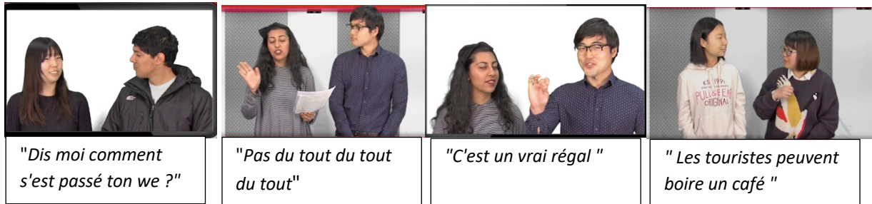
Exemple 3. Extrait du journal filmé (corpus 3)

quant à elle (V) permet de dresser un bilan sur la réalisation du dialogue par les apprenants et de noter les postures, les regards, les mimiques, les gestes. Voici quelques images de ces présentations qui révèlent une posture propre à l'interaction.