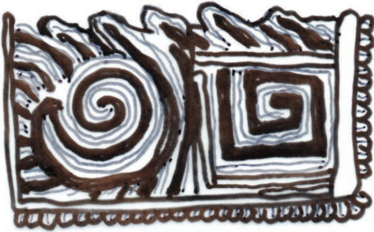
Figura 2. El agua azul y el agua roja al origen de la ciudad. Historia Tolteca-Chichimeca (fl. 16, ms 51-53) in Kirchhoff y Reyes 1989: 29 (dibujo: Dehouve).

al origen de la ciudad de Tula (fig. 2). Generalmente los investigadores los han interpretado como la expresión gráfica de la guerra, “agua/cosa quemada” ( atl tlachinalli ). Pero se puede proponer otra hipótesis, según la cual el primer río, de color azul, designaría, mediante su primer término, el difrasismo “agua azul/agua amarilla” y representaría la justicia. El segundo, de color rojo, figuraría el agua de fuego que designa la guerra.