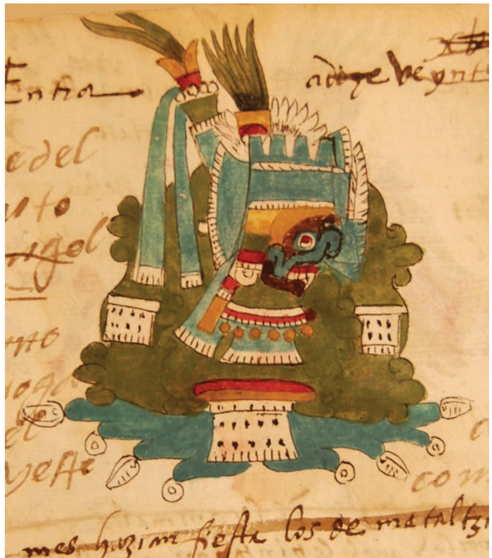
Figura 1. El Agua-cerro con rasgos de Tlalloc, ilustración de la fiesta Huey Pachtli o Tepeilhuitl , fol. 4r, Códice Telleriano Remensis (1995).