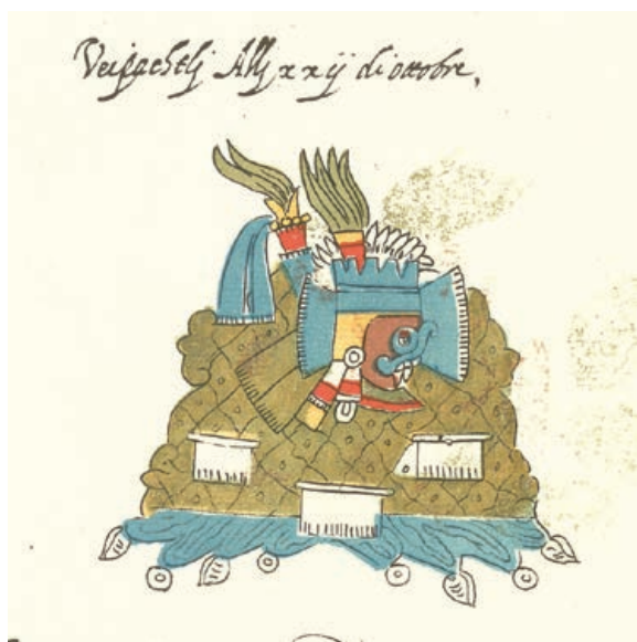
Figura 2. El Agua-cerro reticulado con rasgos de Tlalloc, ilustración de la fiesta Huey Pachtli o Tepeilhuitl , fol. 48v, Códice Vaticano A (1996).

Es más, en la pintura del Códice Telleriano , si se fija uno bien, no hay un cerro sino dos, el uno apoyado contra el otro. De hecho, el cerro, más pequeño que está en primer plano constituye el cuerpo del dios de la lluvia, por lo que propongo que la imagen ha de interpretarse: Tlalloc-Tlallocan- Altepetl . Entonces, sería legítimo preguntarse ¿qué tiene que ver la fiesta Tepeilhuitl o Huey Pachtli con el altepetl ?