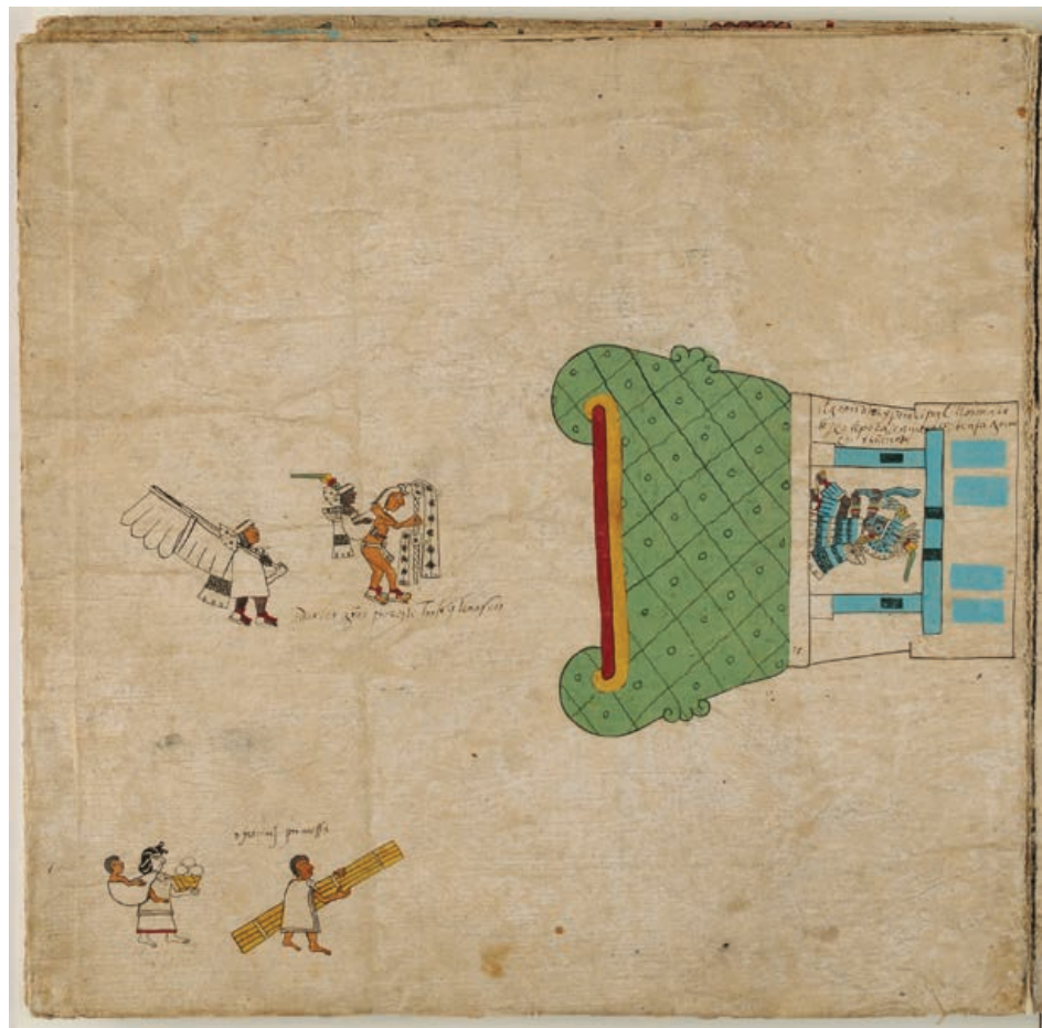
Figura 5. La fiesta Huey Tozoztli, una procesión se dirige hacia la boca de Tlallocan, en forma de un cerro reticulado, lám. 25 (detalle), Códice Borbónico .

Ixtlixóchitl , en realidad se compone de dos piezas superpuestas. De hecho, el ayauhxicolli , “túnica de niebla”, está cubierta de una red, el ayauhquemiltl la prenda “de niebla”. Ahora bien, en Mesoamérica la malla de red simbolizaba la corteza terrestre, la tierra como materia (Beyer 1965: 431). Así se pintan los animales que la encarnan, tales como el Cipactli ( Códice Borgia 1993: 21 y 22) o los cerros, por ejemplo, en el ya citado Códice Vaticano A (Figura 2) o en el Códice Borbónico (Figura 5).