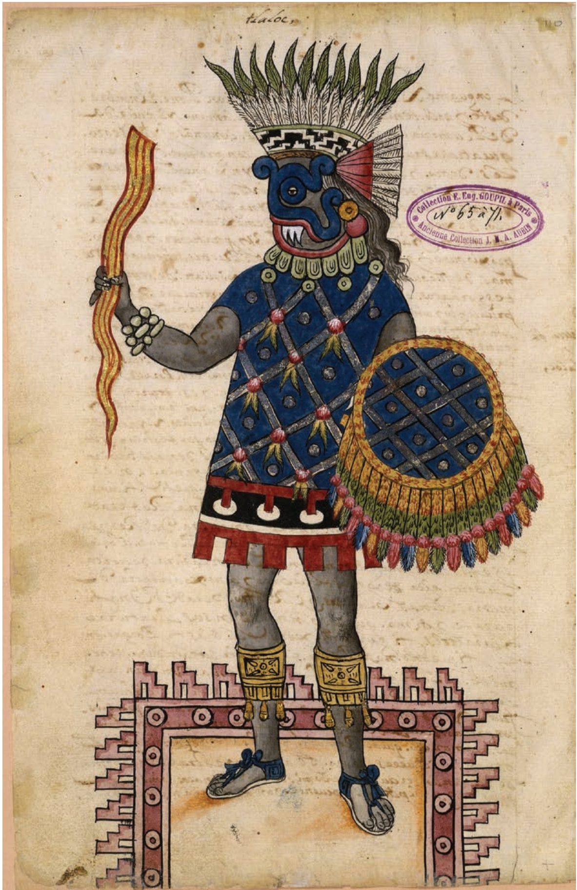
Figura 4. Tlallocantecuhtli, “Señor de Tlallocan” y dios altepeltl , fol. 110v, Códice Ixtlilxóchitl .