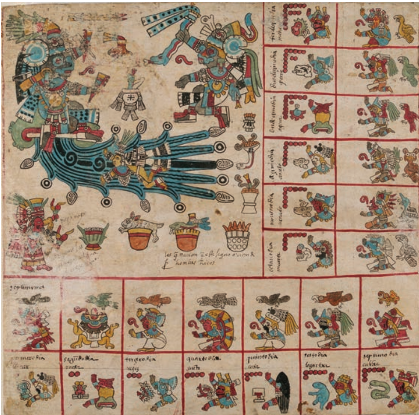
Figura 3. Tlalloc, dios patrono de la trecena Ce-Quiahuitl, Uno-Lluvia. Códice Borbónico , lám. 7, trecena Ce-Quiahuitl, Uno-Lluvia © Bibliothèque de l'Assemblée nationale, 2008. Foto de Irène Andréani. Cortesía de la Biblioteca de la Asamblea Nacional, París.

léxico similar, que hace hincapié en la riqueza de cuantos se benefician del don los dioses de Tlallocan ya que “ellos mismos son ricos”.