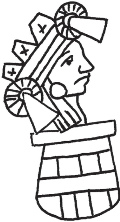
Figura 7. Tepictoton con forma globular. Primeros Memoriales , fol. 267r. Dibujo de Emilien Contel.