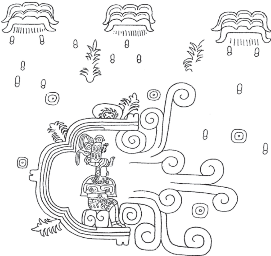
Figura 11. El Relieve 1 de Chalcatzingo, Morelos (Taube 2010: fig. 5.5c, con autorización).