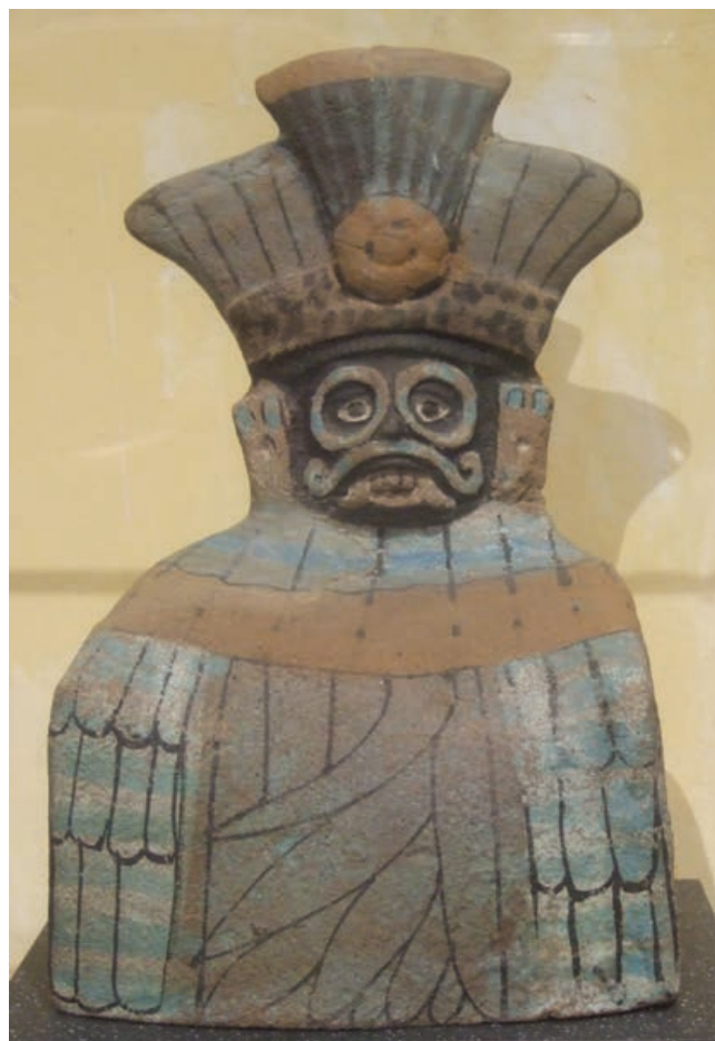
Figura 6. Tlalloc representado bajo su aspecto de dios-cerro o dios altepetl . Las plumas que cubren su cuerpo simbolizan riqueza y abundancia. Estatua tolteca de barro (Posclásico temprano). Museo Nacional de Antropología de México.

No conozco otro Tlalloc emplumado, con excepción de una pieza que se conserva en la sala tolteca del Museo Nacional de Antropología de México (Figura 6). Una estatuilla de barro, pintada a la que le daré el nombre