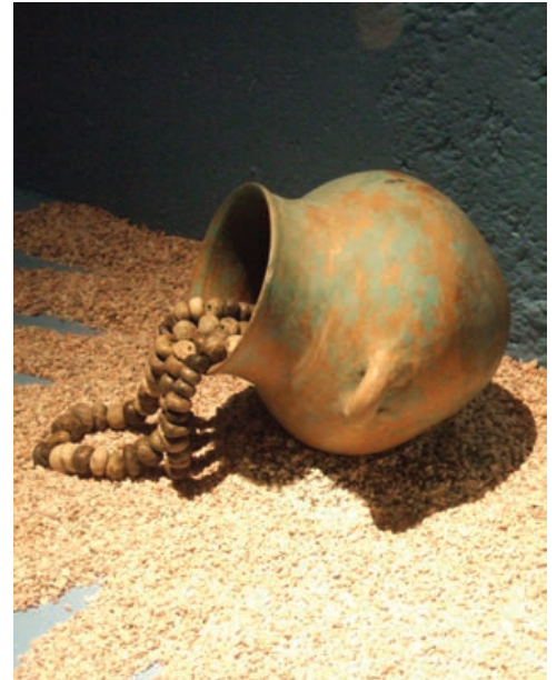
Figura 9. Representación metafórica del Altepetl Tlallocan. Olla acostada con collar de piedras verdes. Ofrenda 43, Templo Mayor.

de Tlalloc precioso de Tollan. Este Tlalloc reconocible a sus elementos simbólicos habituales, tiene el cuerpo cubierto de plumas. Esa representación se distingue por su calidad estética y su originalidad. Su forma es parecida a la de los tepicoton , representaciones de los cerros divinizados (Figura 7) y a una figura de los Primeros Memoriales (Figura 8), o sea al Tlalloc-cerro al que ya me he referido en numerosas ocasiones.