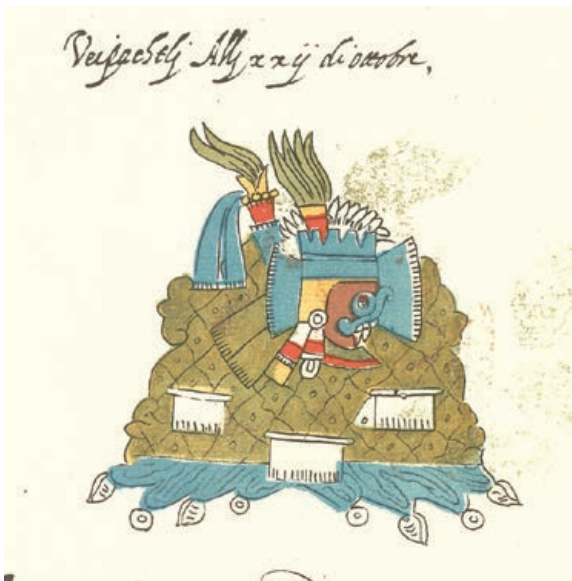
Figura 2. El Agua-cerro reticulado con rasgos de Tlalloc, ilustración de la fiesta Huey Pachtli o Tepeilhuitl , fol. 48v, Códice Vaticano A (1996).

Es más, en la pintura del Códice Telleriano , si se fija uno bien, no hay un cerro sino dos, el uno apoyado contra el otro. De hecho, el cerro, más pequeño que está en primer plano constituye el cuerpo del dios de la lluvia, por lo que propongo que la imagen ha de interpretarse: Tlalloc-Tlallocan- Altepetl . Entonces, sería legítimo preguntarse ¿qué tiene que ver la fiesta Tepeilhuitl o Huey Pachtli con el altepetl ?