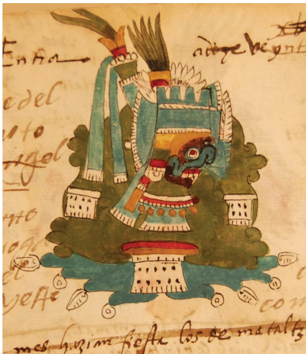
Figura 1. El Agua-cerro con rasgos de Tlalloc, ilustración de la fiesta Huey Pachtli o Tepeilhuitl , fol. 4r, Códice Telleriano Remensis (1995).