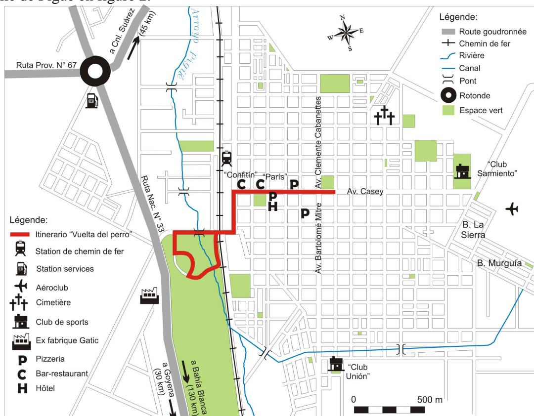
Figure 2 – Carte de Pigüé et localisation des principaux lieux de sociabilisation

Il existe un certain nombre de lieux essentiels à la production et reproduction de la vie sociale à Pigüé. Chacun ayant un rôle particulier. Ces lieux sont reproduits sur une carte générale de la ville de Pigüé en figure 2.