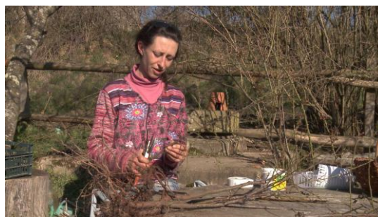
Photogramme film « Paysans on y croit dur comme ferme », J-P Fontorbes, A-M Granié