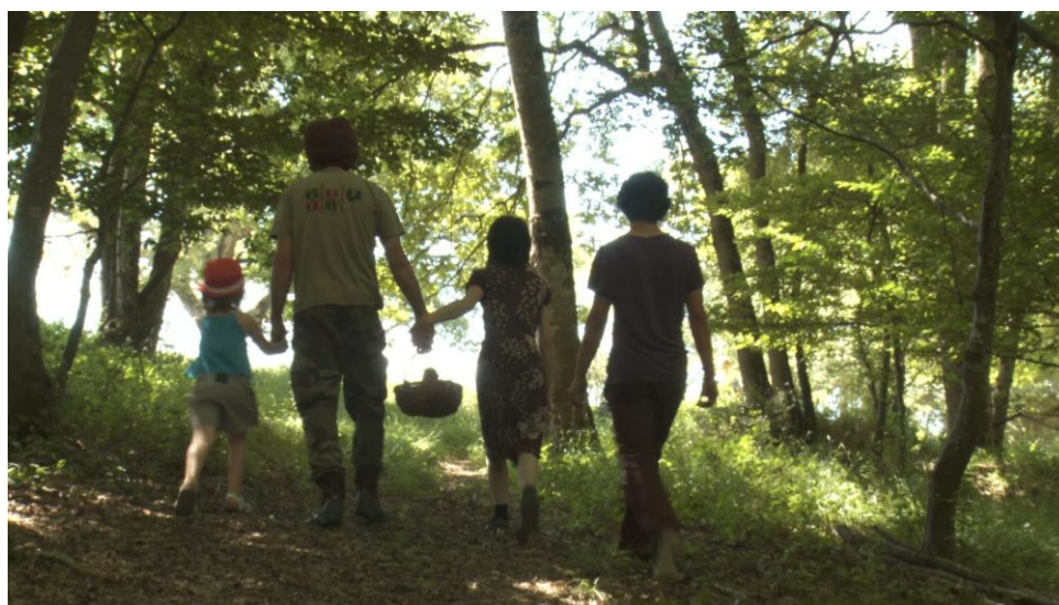
Photogramme film « Paysans on y croit dur comme ferme », J-P Fontorbes, A-M Granié

Le film est dédié « à nos pères paysans », celui de Gilles, Marius, et ceux des chercheurs filmeurs, Armand et Gaston. Peut-être que la proximité originelle a contribué à la proximité filmants filmés.