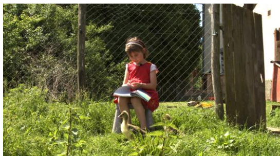
Photogramme film « Paysans on y croit dur comme ferme », J-P Fontorbes, A-M Granié

la famille filmée. L'intime traverse le quotidien. Les véritables images de l'intime sont exprimées dans une situation d'intersubjectivité construite sur la confiance, la compréhension, l'écoute et les émotions partagées.