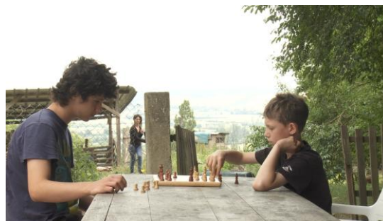
Photogramme film « Paysans on y croit dur comme ferme », J-P Fontorbes, A-M Granié

Notre travail pourrait s'intituler une sociologie filmique du quotidien ou le récit du temps. Néanmoins il y a de l'incomplétude dans ce titre, même si le temps est pour nous une dimension essentielle dans notre écriture filmique du quotidien : le temps de la rencontre, le temps des saisons, le temps qu'il fait, le temps du faire, le temps vécu, le temps raconté, le temps des uns, le temps des autres. Le temps de la rencontre, c'est le temps de la reconnaissance qui comporte des deux côtés une dimension d'intégration. C'est à ce prix que les chercheurs et les filmés rentrent dans le film. L'interaction sociale agit en mêlant l'enthousiasme et l'échange. La famille se percevait à travers nous et dans ce qu'elle faisait chaque jour elle affirmait son identité paysanne devant la caméra. Nous nous percevions comme chaque fois chercheurs filmeurs, comme nous même à partir de ce que les membres de la famille faisaient et nous disaient. « [...] on soutiendra que l'estime de soi constitue la traduction subjective de l'acte de reconnaissance ». (Lazzerie et Caillé 2004, 93).