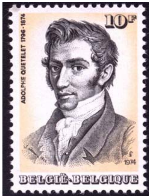
FIGURE 2 – Alphonse Quetelet

Plusieurs élèves de Garnier poursuivront une carrière en Mathématiques. Le plus célèbre est certainement Alphonse Quetelet (1796-1874) 9 . Jean-Guillaume Garnier encadre la thèse Quetelet que ce dernier soutient le 24 Juillet 1819 à Gand. Les deux hommes fondent en 1825 le périodique Correspondance mathématique et physique 10 .