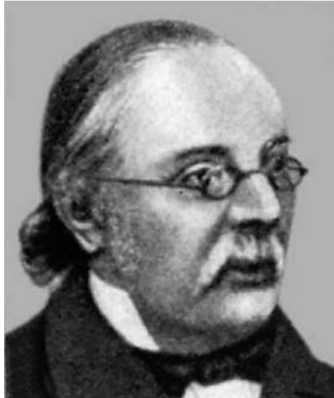
FIGURE 3 – Eugène Catalan 1814-1894

éleva peu à peu le niveau, de sorte qu'il répondit de moins en moins aux besoins de l'enseignement en Belgique.