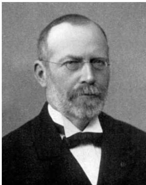
FIGURE 1 – Paul Mansion