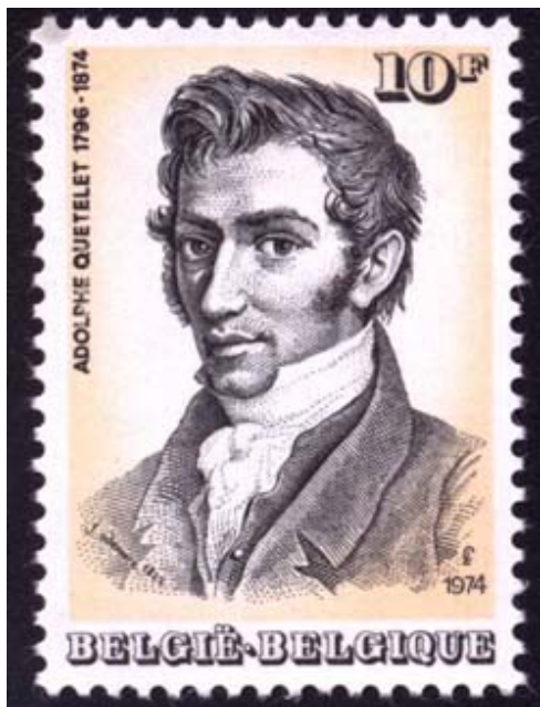
FIGURE 2 – Alphonse Quetelet

Plusieurs élèves de Garnier poursuivront une carrière en Mathématiques. Le plus célèbre est certainement Alphonse Quetelet (1796-1874) 9 . Jean-Guillaume Garnier encadre la thèse Quetelet que ce dernier soutient le 24 Juillet 1819 à Gand. Les deux hommes fondent en 1825 le périodique Correspondance mathématique et physique 10 .