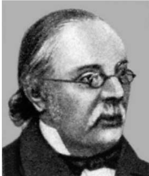
FIGURE 3 – Eugène Catalan 1814-1894

éleva peu à peu le niveau, de sorte qu'il répondit de moins en moins aux besoins de l'enseignement en Belgique.