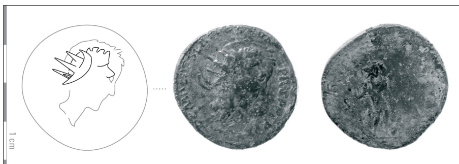
Fig. 1. – Sesterce du Haut-Empire surfrappé au type du monnayage de Postume découvert à Alauna (Valognes, Manche). Poids : 25,83 g. Diamètre : 33 mm. Service de numismatique du CRAHAM (photo et dessin : J.-C. Fossey, CRAHAM).

style, l'effigie impériale se rapproche des productions de l'atelier II. Les premières lettres de la titulature sont encore identifiables : nous y voyons la séquence IMP C M CASS, qui correspond probablement à la légende longue IMP C M CASS LAT POSTVMVS P F AVG des premières frappes en bronze de l'usurpateur. Les reliefs primitifs n'ont été que partiellement oblitérés par cette seconde frappe (Fig. 2). On peut ainsi identifier le profil lauré très reconnaissable d'Antonin le Pieux (138-161) : son portrait est en général bien équilibré et sa coiffure se caractérise par des boucles antérieures ne recouvrant que le haut du front 11 . La titulature ne nous échappe pas complètement : la séquence PIVS P P TR P XXIII à l'avant du portrait est encore visible. La surfrappe occulte le début de la légende où apparaissait le cognomen ANTONINVS associé au titre AVG( ustus ). Dans sa forme complète (ANTONINVS AVG PIVS P P TR P XXIII), cette titulature ramène aux années 159-160 du 4 e consulat 12 .