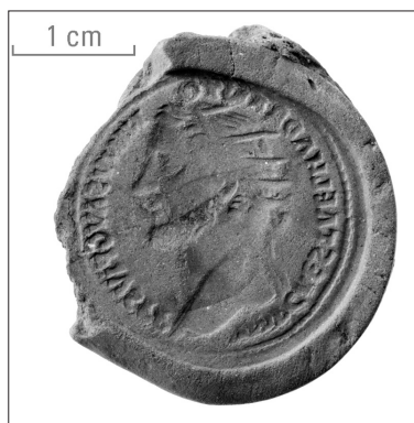
Fig. 3. – Moule monétaire en terre cuite d'un dupondius à l'effigie radiée d'Antonin le Pieux (138-161) découvert à Sées (Orne).

valeur 19 . Nous découvrons une autre preuve de cette prime accordée à la couronne radiée à travers les moules monétaires en terre cuite mis au jour à Sées 20 (Orne). La technique du surmoulage distingue d'emblée la production de Sées de celle des ateliers monétaires impériaux 21 . En effet, ces derniers ont exclusivement recours à la frappe entre deux coins pour imprimer le droit et le revers sur les flans monétaires. En utilisant la coulée en lieu et place de la frappe, la pratique s'inscrit à l'encontre des règles établies par le pouvoir officiel et bascule, de fait, du côté de la contrefaçon répréhensible 22 . À Sées, le surmoulage a précisément porté sur des monnaies en bronze ( dupondii ) de la période des Antonins (98-192), qui présentent toutes une couronne radiée (Fig. 3). Cela étonne