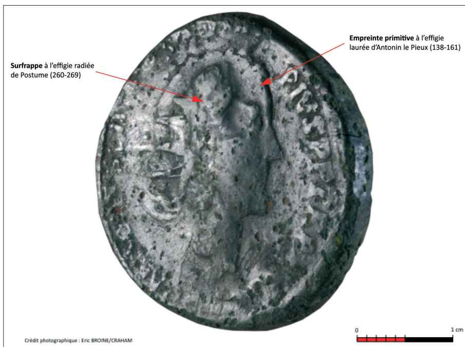
Fig. 2. – Droit surfrappé à l'effigie radiée et à la titulature de Postume.

Le dieu de la guerre y apparaît aussi debout avec une haste et un bouclier 14 . Il convient de signaler une autre particularité. Le hanchement, très caractéristique, de Mars sur notre exemplaire est identique à celui de certaines émissions de l'atelier II 15 . Il faut donc admettre que le revers du sesterce de Valognes a lui aussi été surfrappé, le type originel ayant complètement disparu sous l'empreinte du nouveau coin.