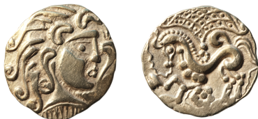
Figure 1 - Statère des Parisii découvert au Molay-Littry (Calvados).

C'est à l'occasion d'une trouvaille effectuée fortuitement en janvier 2017, dans le département du Calvados (commune du Molay-Littry, INSEE 14370), que l'opportunité nous est donnée aujourd'hui de compléter la connaissance de ce monnayage 5 . En excellent état de conservation, la pièce, un statère d'or, se situait en dehors de tout contexte archéologique 6 . Rien en apparence ne justifie sa présence à cet endroit. On peut en donner la description suivante (figure 1) :