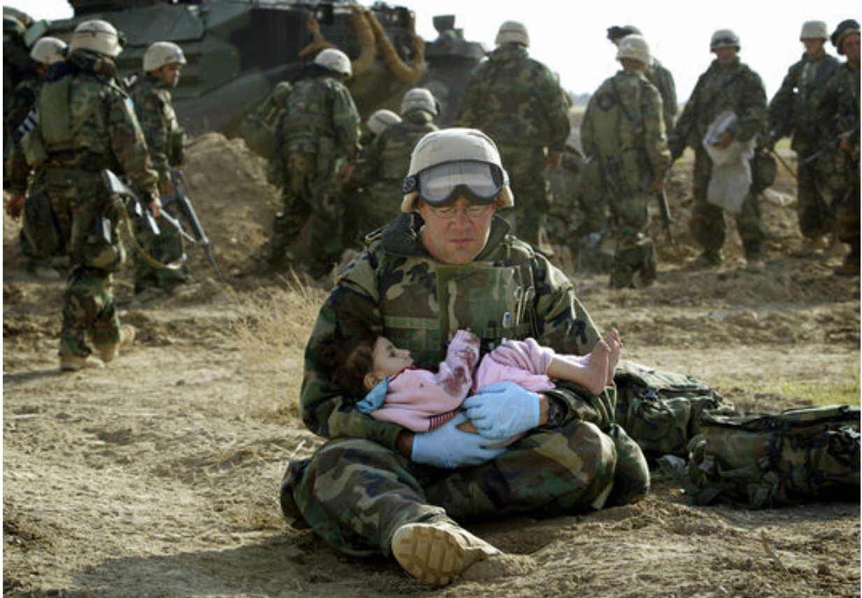
Photographie 10 : une belle opération de propagande, ...à ricochet.

Embedded, le photojournaliste bosnien Damir Sagoli offre en mars 2003 l'image d'un GI en pleurs tenant dans ses bras une petite fille irakienne, blottie contre lui.