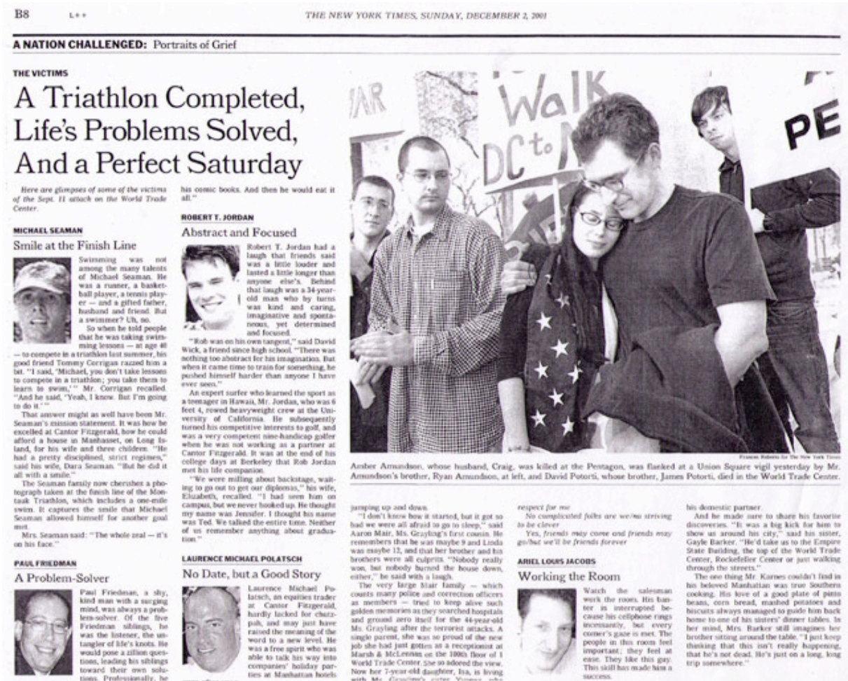
Photographie 3 – Les portraits of grief publiés par le New York Times après l’attentat du World Trade Center

Un tournant narratif (Kreiwirth, 1992) est pris avec l’irruption du storytelling fin du XX e siècle, dont la photographie devient le support indispensable, contribuant ainsi à l’accélération de la « mise en histoire de la politique » (Salmon, 2007). George W. Bush mesure immédiatement l’intérêt électoral de l’ Ashley’s story : son spot de campagne immortalise l’émotion aux larmes de cette jeune fille, prostrée depuis le décès de sa mère dans les attentats du 11 septembre et que l’étreinte avec le président des Etats-Unis débloque, soudain !