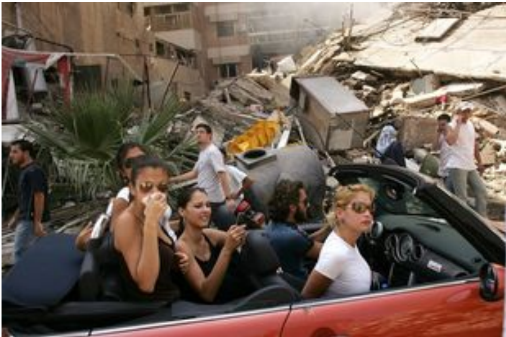
Photographie 7 : « Non représentative des atrocités » !

Ainsi, l'attribution du World Press Photo en 2007 à Spencer Platt a-t-elle créé polémique dès l'annonce du prix, née du sentiment d'indécence provoqué par l'accompagnement photographique de la promenade charognarde de jeunes oisifs en tenue provocatrice, touristes voyeuristes des champs de ruine dans le sud de Beyrouth, ce 15 août 2006 à la fin de la guerre entre Israël et le Liban.