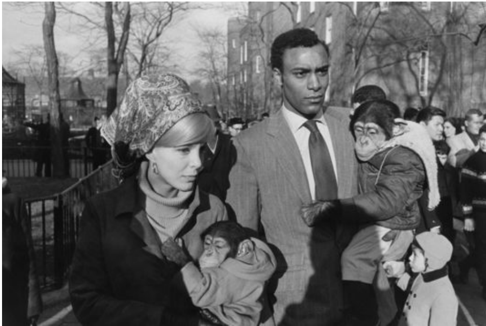
Photographie 8 : simplement, une scène anodine qui se présente au photographe au zoo.

publication en 1967 dans le livre Animals de la photographie d'un couple mixte avec singes, composée par Garry Winogrand, avait suscité les accusations de racisme.