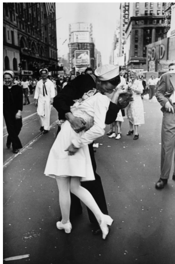
Photographie 9 : l'image la plus romantique du monde !

L'image la plus romantique du monde de ce marin et de cette infirmière s'embrassant avec passion à Times Square pour célébrer la capitulation du Japon le 14 août 1945, était devenue le symbole du V-J Day ( Victory over Japan Day ) admirablement composée par Alfred Eisenstaed, au point d'avoir longtemps été accusée de n'être qu'une mise en scène.