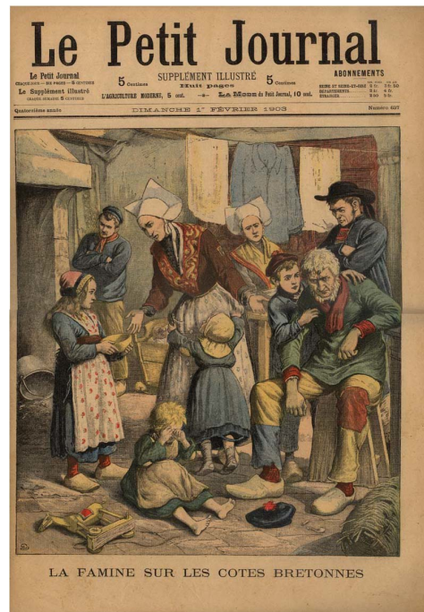
Photographie 1 –

un enregistrement objectif des gestes et des objets loin des défaillances de la mémoire » (Piault, 2000 :13) et dont la naissance correspond à celle de l'anthropologie coloniale. La photographie s'offre avec cette nouvelle vertu probatoire, recherchée par le photo-journalisme.