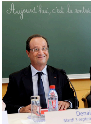
Photographie 12 : une rentrée scolaire mouvementée pour le Président Hollande