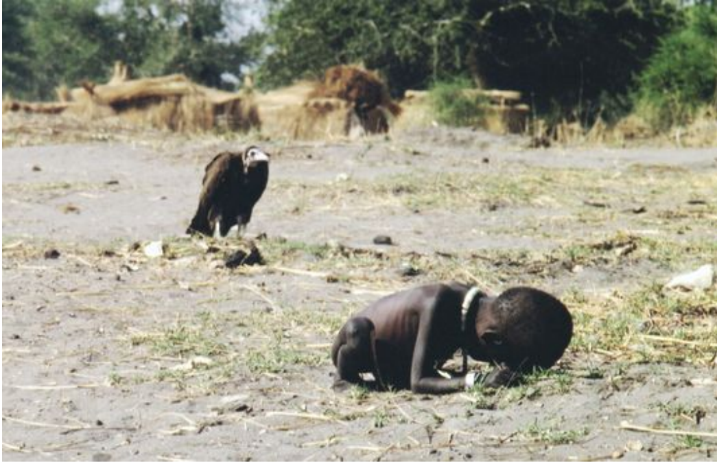
Photographie 12 : la détresse humaine, guettée par les charognards.

Le photographe y gagna un prix Pulitzer en 1994 et un ...suicide trois mois plus tard, ne s'étant jamais vraiment remis ni de l'angoisse de ce qu'il avait vu, via l'objectif de son appareil, ni paradoxalement des assimilations au vautour dont il avait fait l'objet par les critiques acerbes contre le photojournalisme prédateur ! Une fois de plus, cet épisode dramatique du voyage photographique appelait relecture quand vingt ans après, l'ami de Carter rendait enfin justice au photographe, témoignant des fantômes qui avaient hanté ce dernier dans son propre exercice professionnel et du sort de l'enfant représenté, effectivement mort depuis des suites des fièvres intenses provoquées par une crise de paludisme... quatorze ans après le cliché ! 11 .