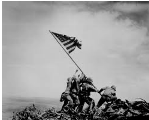
Photographie 2 – Le cliché de Joe Rosenthal, symbole mis en scène ? de la victoire US dans le Pacifique, prix Pulitzer 1945

L'image fixe aurait pu être écrasée par son homologue animée. Mais la Grande Guerre révèle le rôle éminemment propagandiste de la carte postale, à l'origine même de l'expression « bourrage de crâne », inventée par un poilu anonyme (Morin, 2012). Parce que la photographie pointe un seul et unique instant, cette logique de paralysie lui octroie une prévalence, en terme d'instantanéité du fragment par rapport à la séquence, une résonance émotionnelle se dégageant ainsi, plus forte, du déclic de la prise de vue fulgurante (Bassenne, 2011). Roland Barthes interroge ainsi la photographie, dont le principe est le choc. La première « surprise » possible naît de la rareté du sujet photographié. Elle peut aussi être liée à l'instant décisif capturé au bon moment. Elle peut relever de la prouesse, révélant un phénomène invisible à l'œil nu. Elle peut enfin procéder de la contorsion technique, avec la retouche, le montage, le flou... (Barthes, 1980 : 7). À la fin du XX e siècle, on peut encore glorifier ces photographies, supposées avoir changé le monde : images de l'attaque de Pearl Harbour ; saisie-arrêt sur Martin Luther King s'adressant à Nelson Mandela en prison... L'image se révèle dans les jeux d'acteurs (Stepan, 2000). Jouant l'effet mémoriel, elle travaille alors la puissance du symbole, lorsque, par gommage de toute trace énonciative, la plongée dans l'anonymat œuvre à accélérer l'identification collective, comme lors des combats d'Iwo Jima dans le Pacifique (Cabanes, 2006).