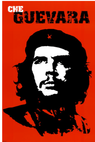
Figure 6 : la photographie sacralise le personnage-héros

Alberto Korda le 5 mars 1960 en constitue sans doute le symbole le plus évocateur (Gott, 2004 et 2006).