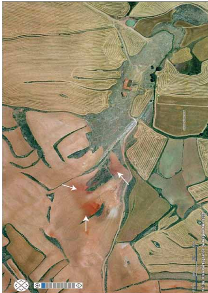
Figura 5. Localización de los posibles escoriales, señalados mediante flechas. © Lidia C. Allué Andrés, a partir de la ortofoto del año 2000, disponible en < http://sitar.aragon.es/visor/ >