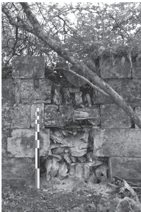
Fig. 9 : Abbaye de Haute-Seille. Le blocage en épi apparaît derrière un contrefort arraché.