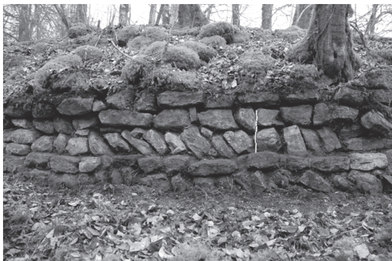
Fig. 5 : Parement de l'enceinte des « Tours Sécheltes ». Photo C. Moulis.

La commune de Saint-Baslemont (Vosges) possède sur un éperon rocheux à l'écart du village les vestiges d'un château anhistorique, appelé depuis la période moderne « Tours Sécheltes ». Il présente les vestiges d'une enceinte de basse-cour, d'au moins un mètre de largeur, dont le parement extérieur est composé alternativement de rangs de pierres posés à plat et en épi (fig. 5). Le rang en épi le plus haut observé possède 12 pierres alors que celui en dessous en comporte au moins 17. Les pierres font entre 25 cm et 30 cm de long pour une épaisseur comprise entre 10 cm et 20 cm. Leur disposition et leurs mensurations rappellent fortement celles observées à Épinal ; les deux maçonneries pourraient donc être contemporaines, mais cette hypothèse demande à être vérifiée par une fouille.