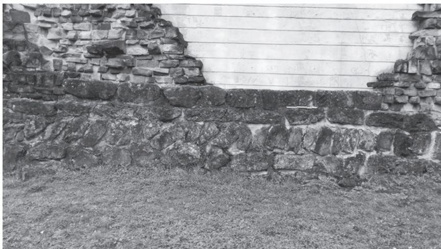
Fig. 4 : Château d'Épinal. Vestige de maçonnerie en épi à l'intérieur du donjon.

À Épinal (Vosges), il existe sur le site du château les vestiges (quelque peu restaurés par ailleurs) d'un mur présentant une alternance d'assise plate et d'assise en épi (fig. 4). Les pierres font 25 cm à 30 cm de long pour une épaisseur variant de 10 cm à 15 cm. Si cette maçonnerie a été perçue par nos prédécesseurs comme un premier plan, abandonné, du donjon du XIII e siècle 17 , il nous semble plus pertinent d'y déceler la trace d'une construction antérieure.