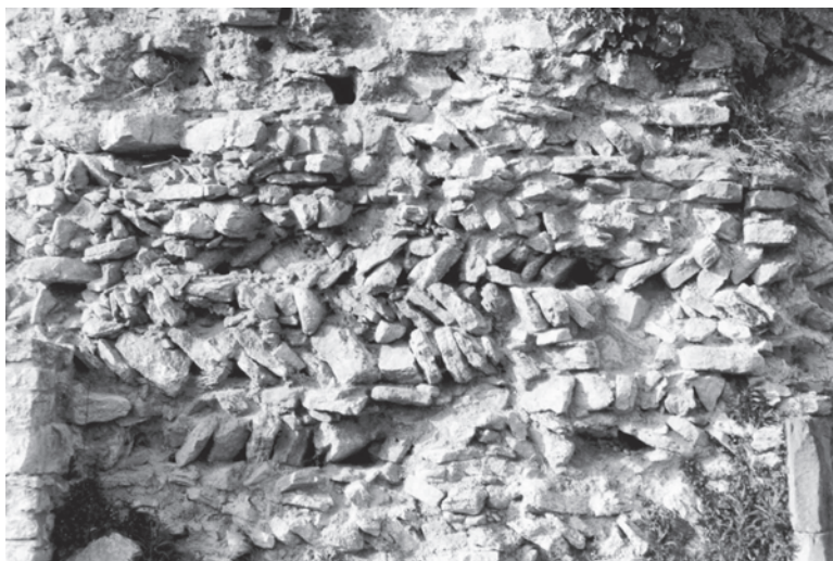
Fig. 8 : Château de Blâmont, courtine nord. Blocage en épi.