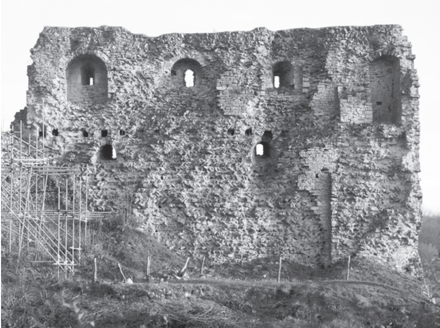
Fig. 11 : Donjon de Vaudémont, mur sud-est. Le parement intérieur arraché, permet d'observer la disposition en épi du blocage.

Le blocage des angles du donjon est traité de trois façons différentes. Soit les épis continuent dans la même inclinaison, et forment un arc de cercle en tournant pour s'aligner avec le mur suivant. Dans ce cas, l'ensemble est réalisé lors d'une même phase de montage. Soit les épis s'entrecroisent à un endroit donné, montrant ainsi une jonction entre deux rangs isométriques réalisés en des temps ou par des équipes différents. Soit les pierres sont posées à plat. On retrouve ce procédé dans quelques niveaux de réglage, toujours dans le blocage.