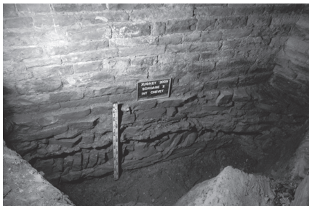
Fig. 3 : Fondations du chevet de la chapelle Saint-Jean-Baptiste de Xugney.

Le troisième édifice présentant ce dispositif est la chapelle Saint-Jean-Baptiste de la commanderie templière de Xugney (Rugney, Vosges). Ses fondations en épi affleurent dans la première travée de la nef, mais elles ont été observées dans de meilleures conditions lors de sondages effectués en 2009 de part et d'autre d'un pan du chevet pentagonal. On y aperçoit des fondations peu profondes, et parmi les assises plus ou moins régulières, une rangée de pierres disposées en épi sur une longueur d'au moins deux mètres. Certaines pierres sont placées quasiment à la verticale, sans doute à cause de leur faible longueur (fig. 3).