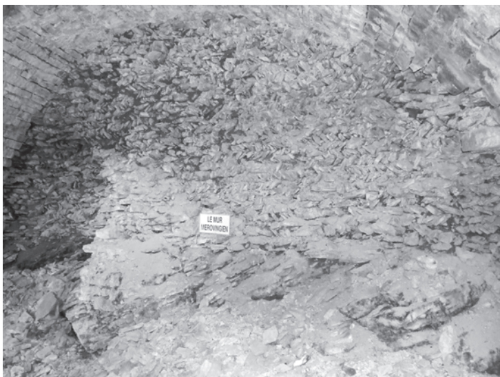
Fig. 12: Château d'Arlay. Blocage en épi qui rappelle celui observé à Vaudémont. Photo C. Moulis.

L'agencement des maçonneries en épi reste un domaine peu étudié, et particulièrement en Lorraine. Les principales connaissances que nous possédons au niveau national sont essentiellement sur les parements en épi, car ils sont facilement identifiables. On a encore moins de données sur les fondations et les blocages. Ces lacunes expliquent les problèmes de datation que l'on rencontre sur ces constructions. Toutefois, dans les cas les plus éloquents, les historiens de l'art des XIX e et XX e siècles ont amalgamé ce dispositif à l' opus spicatum observé sur les maçonneries romaines. Beaucoup de sites ont été ainsi datés de périodes reculées du seul fait de l'existence de cette structure en épi. Dans certains cas, comme les épis étaient moins soigneusement réalisés que dans les murs romains, on en a déduit qu'ils devaient dater de la période mérovingienne, perçue traditionnellement comme une période de décadence dans l'art de bâtir. Ainsi le donjon de Vaudémont a été dénommé « Tour Brunehaut » en partie pour ces raisons 27 . Un second cas très caractéristique est identifié hors de notre zone d'investigation, au château d'Arlay dans le Jura. Un pan de mur, qui correspond vraisemblablement au vestige d'une tour quadrangulaire du château primitif (X e siècle), est indiqué encore aujourd'hui comme Mur mérovingien (fig. 12).