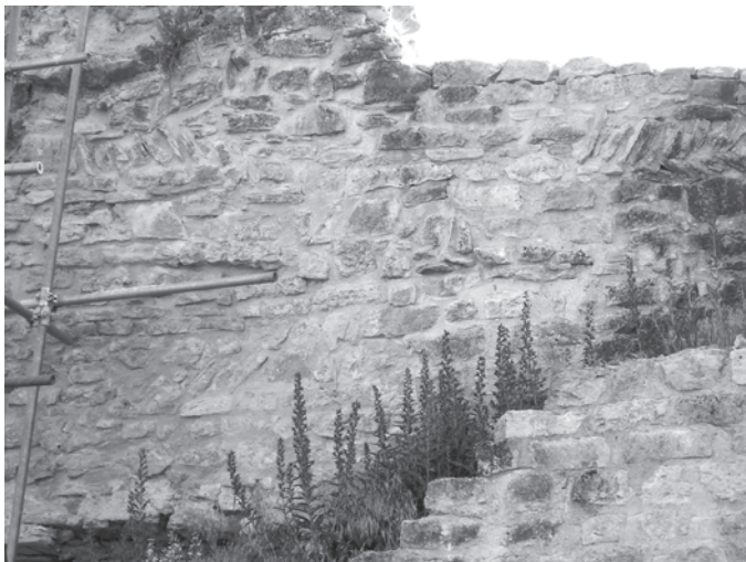
Fig. 6 : Château de Blâmont, courtine est. Rangs d'épis partiels en parement.

ponctuel, et qui n'est composé que de quelques pierres (une quinzaine au maximum) sur une seule assise 19 . On ne retrouve ce type 2 que deux ou trois fois sur la totalité de cette enceinte, ce qui montre là encore le caractère très circonstancié de cette technique.