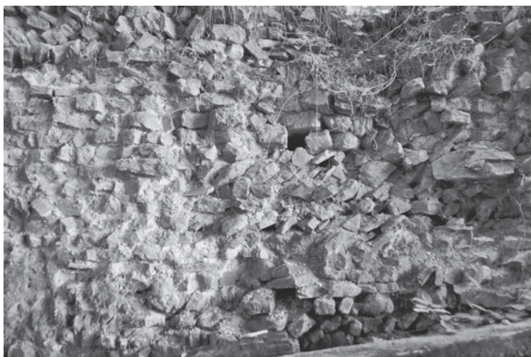
Fig. 7 : Tour seigneuriale de Darnieulles. Blocage du mur est.

La tour seigneuriale de Darnieulles (Vosges) est un édifice rectangulaire de 11 m x 15 m de côté pour 12 m de hauteur. Le parement est essentiellement constitué de moellons calcaires posés à plat. Les nombreuses brèches dans la maçonnerie permettent d'observer que le blocage est en partie constitué de pierres disposées en épi, et ce quel que soit le pan de mur et quelle que soit la hauteur dans l'élévation 21 . Les pierres employées sont d'un module assez petit (17 cm x 8 cm) et sont regroupées en segments d'assises de quelques décimètres à deux mètres de long au maximum (fig. 7). Leur agencement rappelle celui autrefois visible sur le donjon de Jaujac (Ardèche) 22 .