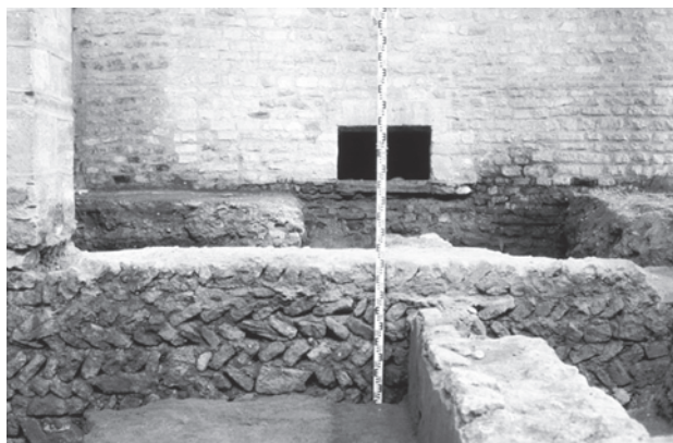
Fig. 2 : Fondations de la phase 3 de l'église Saint-Pierre-aux-Nonnains à Metz.

Le troisième édifice présentant ce dispositif est la chapelle Saint-Jean-Baptiste de la commanderie templière de Xugney (Rugney, Vosges). Ses fondations en épi affleurent dans la première travée de la nef, mais elles ont été observées dans de meilleures conditions lors de sondages effectués en 2009 de part et d'autre d'un pan du chevet pentagonal. On y aperçoit des fondations peu profondes, et parmi les assises plus ou moins régulières, une rangée de pierres disposées en épi sur une longueur d'au moins deux mètres. Certaines pierres sont placées quasiment à la verticale, sans doute à cause de leur faible longueur (fig. 3).