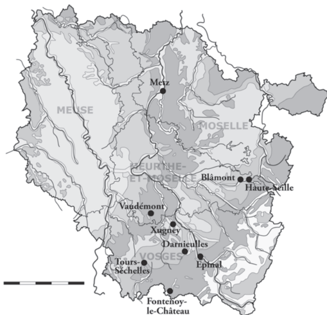
Fig. 1 : Les sites lorrains avec maçonnerie en épi attestée.

Nous avons commencé à examiner cette question lors de la constitution d'un Projet Collectif de Recherche (PCR) sur « La pierre en Lorraine aux périodes historiques, de l'extraction à la mise en œuvre ». Nous reprenons également de manière plus approfondie cette thématique dans le cadre d'une thèse de doctorat actuellement en cours.