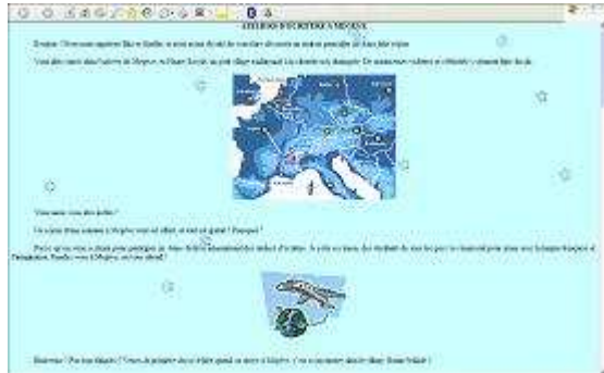
Figure 1 – Ecran d'accueil du scénario Megève.

Nous pouvons d’ores et déjà constater que les écrans d’accueil des trois scénarii sont semblables dans le sens où tous contiennent des éléments culturels riches constitués d’images, de texte et de musique 2 .