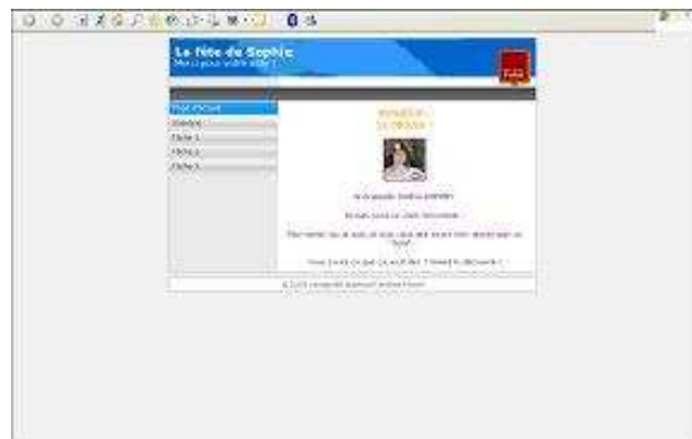
Figure 3 - Ecran d'accueil du scénario Polynésie.

Intéressons nous alors de plus près à ces écrans et observons les énoncés qu’ils contiennent :