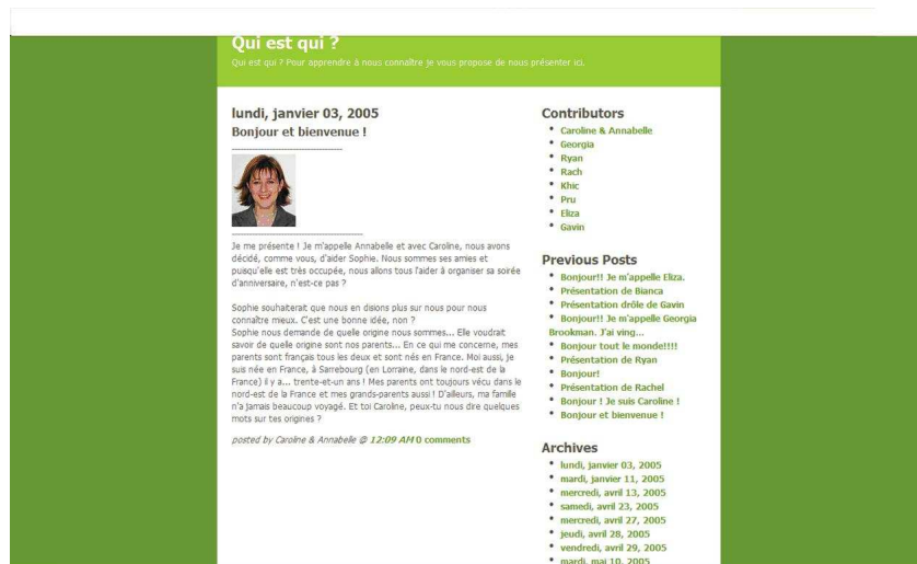
Figure 5 - Présentation d'une tutrice sur le blog.

La première tutrice a répondu aux questions posées par "Sophie" et demande à sa collègue tutrice d'en faire autant avec un ton amical.