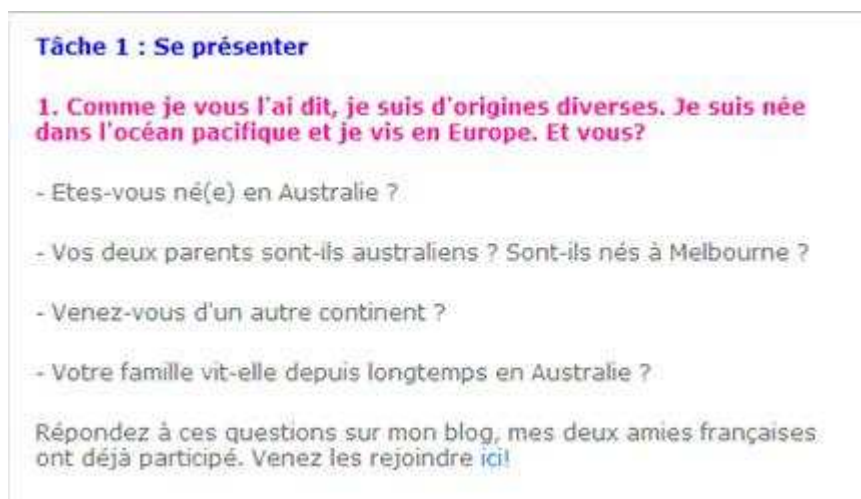
Figure 4 - La tâche de présentation (Polynésie).

Toujours en poursuivant notre cheminement, c'est sur le troisième écran que "Sophie" propose à ses amis de se présenter en posant quatre questions ouvertes sur les origines.