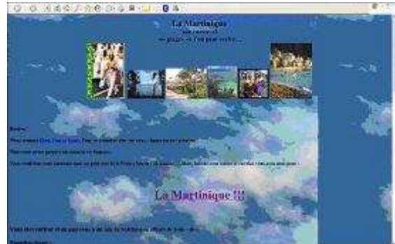
Figure 2 – Ecran d'accueil du scénario Martinique.