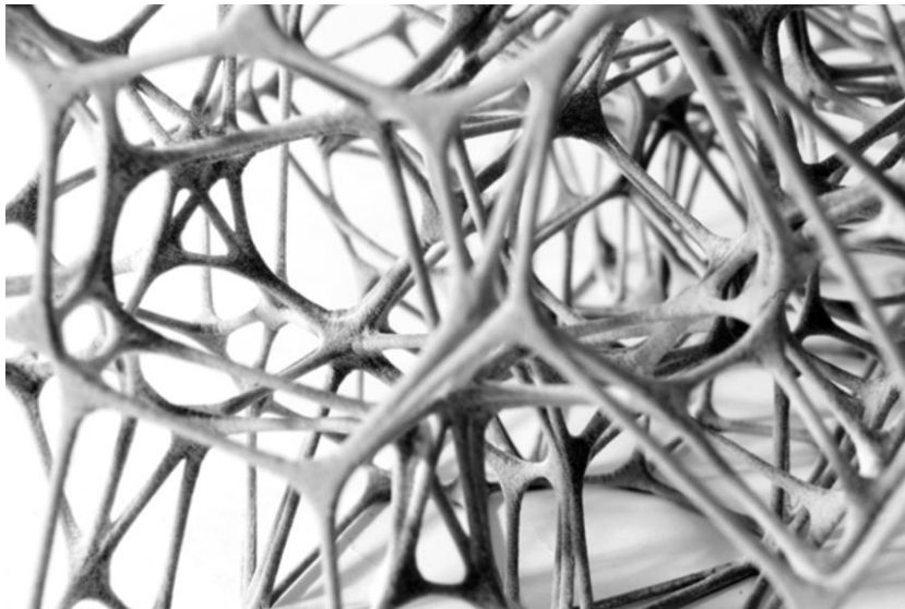
Fig. 2 : Géométrie et performance, maquette impression 3D, ENSA Lyon.