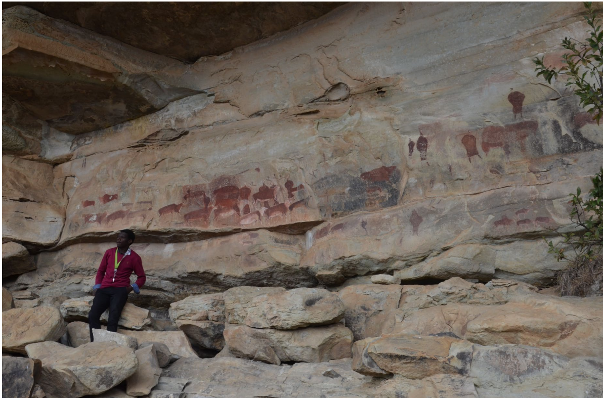
Figure 1 : le site de Game Pass Shelter, localisé dans la réserve naturelle de Kamberg (partie centrale du bien inscrit au patrimoine mondial) dont la réalisation des fresques est attribuée aux San. Crédit photo Mélanie Duval, 2009.

identifiés. Ces abris contiennent des peintures dont les plus anciennes auraient été réalisées entre 2000 et 3000 avant notre ère et les plus récentes à la fin du XIX e siècle. La majorité d'entre elles est attribuée aux Bushmen (également appelés San), peuple de chasseurs-cueilleurs peuplant les contreforts du massif avant l'arrivée successive des populations bantoues et européennes (cf. figure 1).