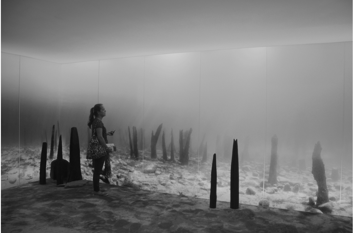
Fig. 5. Salle immersive du nouvel espace d'accueil du musée des palafittes d'Unteruhldingen sur le lac de Constance (Allemagne). © Photo Mélanie Duval, août 2016.