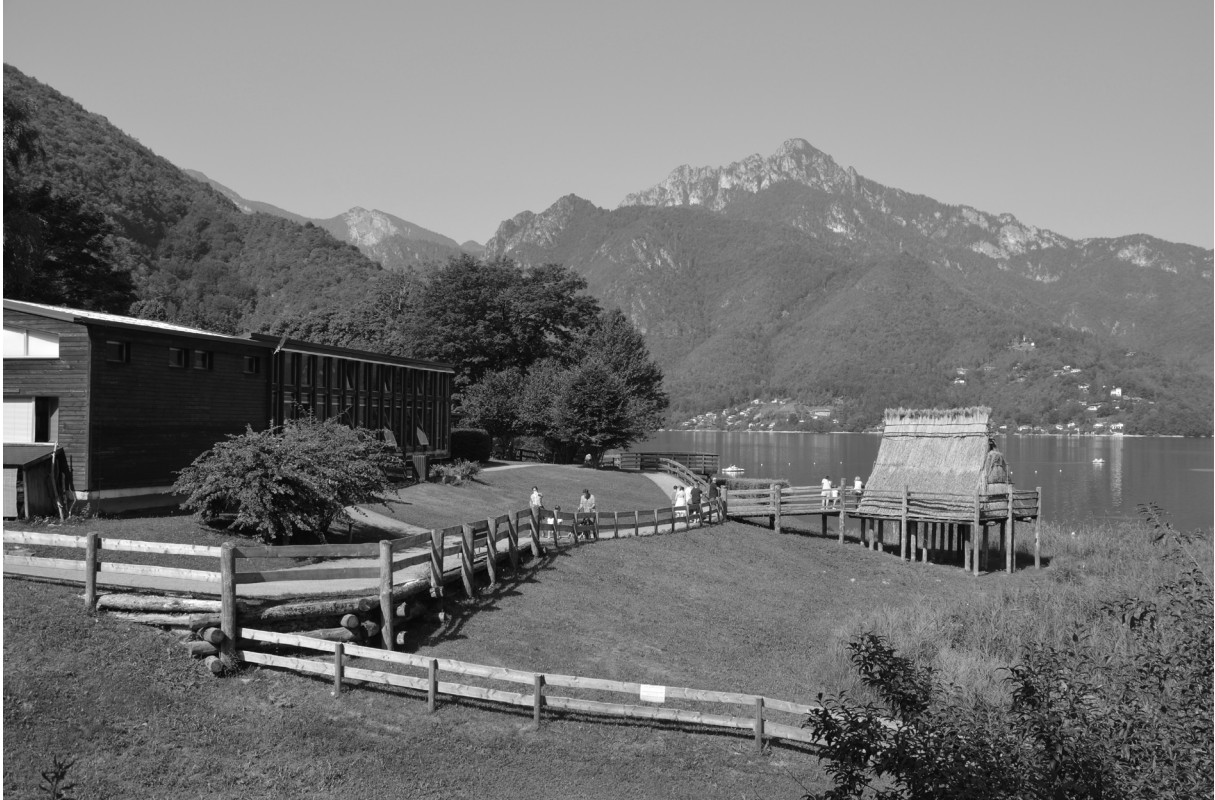
Fig. 3. Au nord du lac de Garde, en Italie, le Museo delle Palafitte del lago di Ledro associe une structure muséale et des reconstitutions d'habitats . © Photos Mélanie Duval, août 2017.