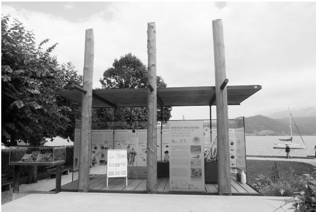
Fig. 2. Station lacustre sur le bord du lac d'Attersee.

Approche typologique des principaux dispositifs de médiation et de valorisation des sites palafittiques inscrits au Patrimoine mondial (correspondance entre la numérotation de la figure et les numéros indiqués entre crochet dans le texte). © Mélanie Duval, Ana Brancelj et Christophe Gauchon.