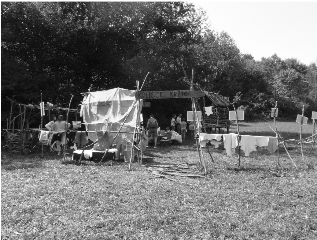
Fig. 4. Fête de Koliščarski dan (littéralement « journée des palafittes »), commune de Ig, Slovénie © Photo Ana Brancelj, août 2017.