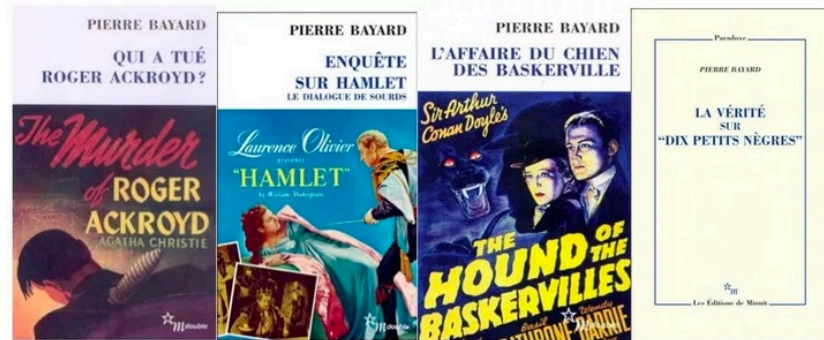
Polars théoriques de Pierre Bayard : une « trilogie en quatre parties » (1998-2019)

À lire cette contre-enquête passionnante tout aussi ludique que pertinente, on conçoit que Pierre Bayard ait été intronisé Président d'honneur de l'organisation Intercripol , visant à rouvrir des enquêtes manifestement inachevées (voire bâclées), à retrouver des personnages disparus et autres affaires qu'il serait bien léger de considérer comme closes. Avec cette Vérité sur « Dix petits nègres » qui vient clore (pour mieux la rouvrir) une « trilogie en quatre parties », Pierre Bayard fait vaciller nos certitudes et nous entraîne dans un jeu de pistes, élevant la critique au rang du roman d'énigme. Le roman de chambre close y devient le métonyme de tout texte, qu'il s'agisse de sa conception ou de son interprétation (comment entrer dans le texte, comment s'en échapper). Si, des mythes aux romans contemporains, nous sommes indéniablement des êtres de récits, si toute île est « l'incarnation spatiale du « il était une fois » », l'enquête telle que la pratique Pierre Bayard dans ses fictions théoriques apparaît plus que jamais comme l'une des formes les plus foisonnantes et porteuses du contemporain .